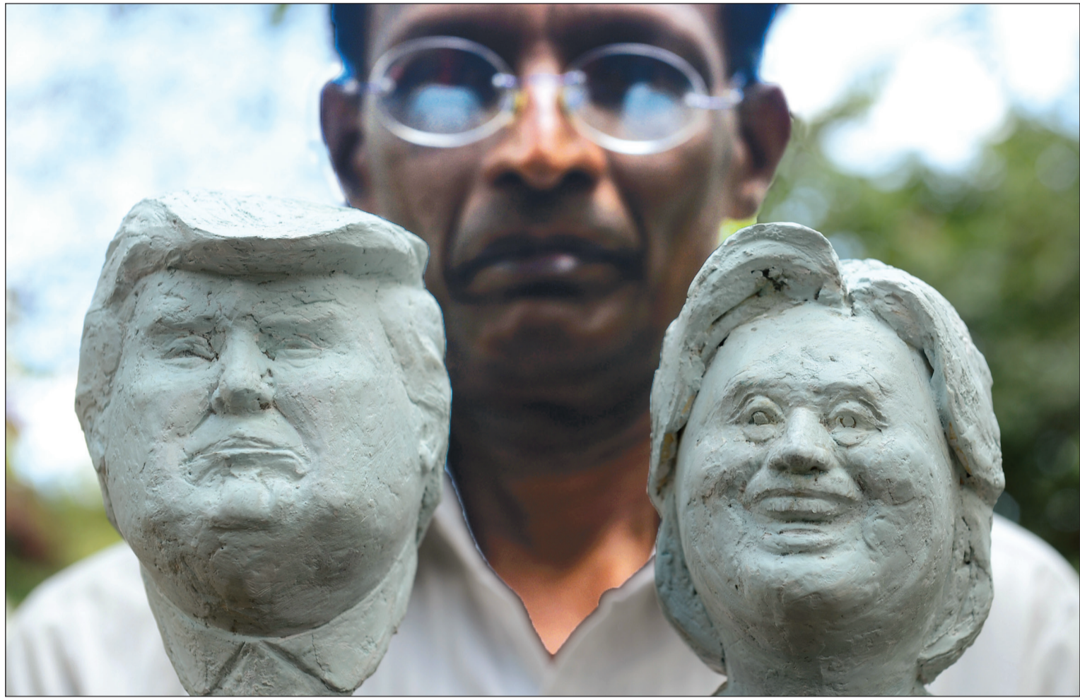
تمثالان لرئيسي المرشحين ترامب وهيلاري كلينتون من عمل الفنان السريلانكي اوبالي دياس

الجمهوري البارز ومرشحه للرئاسة في العام 2008، سحب دعمه رسميا لترامب قائلا في بيان: «لقد أردت دعم مرشح حزبي. هو لم يكن خيارا، ولكن كمرشح سابق اعتقدت أنه من المهم أن أحترم حقيقة أن دونالد ترامب فاز بغالبية المندوبين في إطار القواعد التي وضعها حزينا. اعتقدت أنني مدين لأنصاره بهذا الاحترام». وأضاف: «لكن سلوك ترامب هذا الأسبوع، الذي يتلخص في الكشف عن تصريحاته المهينة حيال النساء وتقاعره بهتجته الجنسية، يجعل مواصلة تقديم الدعم لترشيحه حتى لو كان مشروطا، أمرا مستحيلا». وتابع: «زوجتي وأنا لن نصوت له». وأكد السيناتور الجمهوري: «لم أصوت أبدا لمرشح رئاسي ديمقراطي، ولن أصوت لهيلاري كلينتون. سنكتب اسم جمهوري محافظ جيد مؤهل ليكون رئيسا». بدوره، حث الحاكم السابق لولاية كاليفورنيا آر توند شوارزنيغر الجمهوريين على سحب تأييدهم لترامب قائلا: «أريد أن أتوقف اليوم للحظة كي أذكر زملائي الجمهوريين بأنه ليس فقط من المقبول أن تفضل بولدك على حزبك - إنه واجب». وانضمت وزيرة الخارجية الأميركية السابقة كوندوليزا رايس إلى مجموعة متزايدة