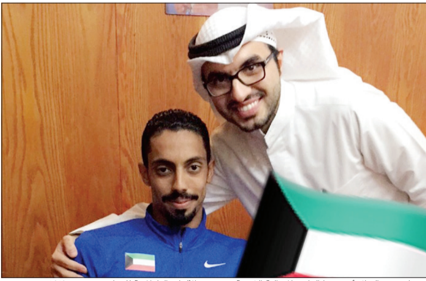
بهبهاني مع البطل أحمد نفا الفائز بالميدالية الذهبية في دورة الألعاب البارالمبية للمعاقين في ريو 2016