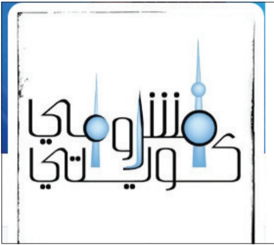
شعار «مشروع كويتي»

وتفاصيلها مثل «مشروع تطوير قصر السلام» و«مشروع تطوير المركز العلمي» و«مشروع جسر الشيخ جابر وصلة الصبية» و«مشروع توسعة مجمع 360» و«طريق الجهراء» وغيرها من المشاريع المهمة في البلد.