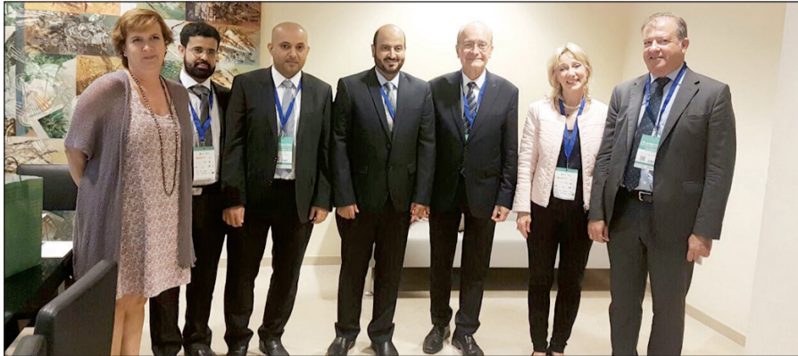
ديبر الطويل ومساعد المحيبي وم.سالم الحبيب مع محافظ ملقا م.فرانسيسكو دي توري ومنظمي المؤتمر

مع رؤية الحكومة القادمة. أبرز توصيات المؤتمر