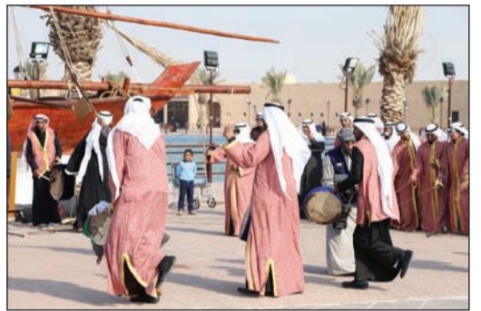
من فعاليات الفنون الشعبية

أعلنت اللجنة العليا لقرية صباح الأحمد التراثية أن مسابقات الموروث الشعبي بكافة أنواعها ستنتطلق بدءاً من 15 يناير من العام المقبل، وتستمر منافساتها إلى الأول من شهر مارس من العام ذاته، وذلك تزامناً مع احتفالات القرية التراثية بالأعياد الوطنية.