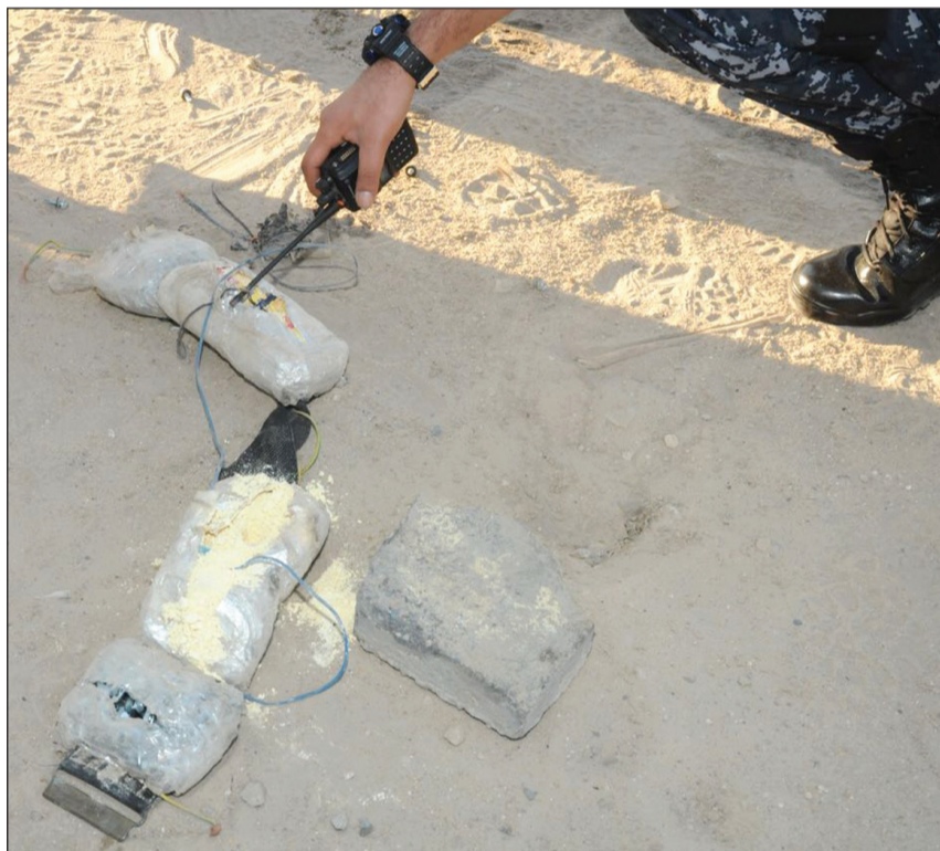
البودرة المضبوطة أحييت إلى الأدلة الجنائية