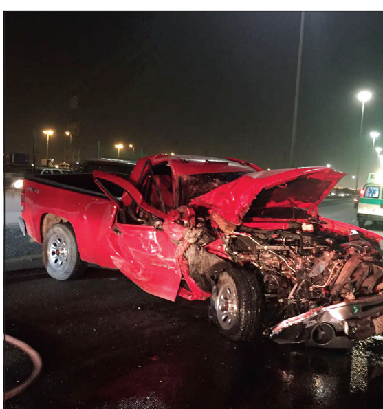
السيارة الثانية في حادث «السالمي» تعرضت لتلفيات جسيمة