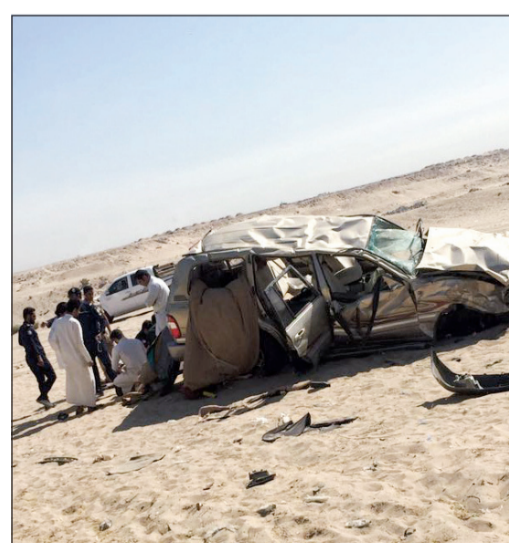
من حادث «السالمي» العنيف