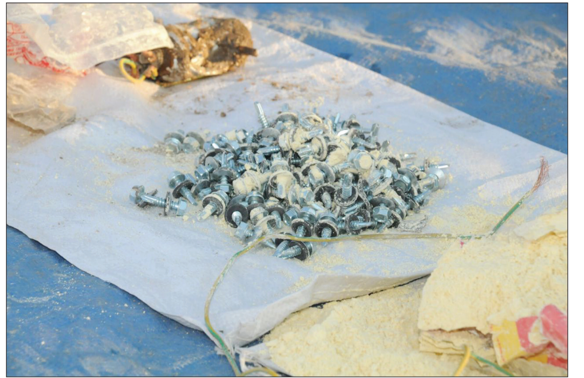
مسامير عثر عليها بحوزة «الداعشي»