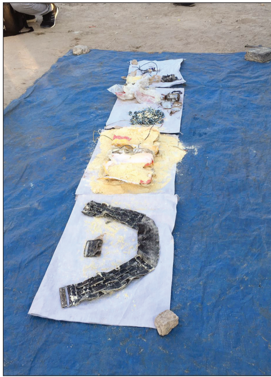
من المضبوطات بحوزة الإرهابي

استجندت فتاة برفقة عمليات الداخلية 112 للتخلص من شخص وصفته بالـ «هتلي» بعد أن قام بمطاربتها داخل احد المجمعات الشهيرة في محافظة الاحمدي، وقال مصدر امني إن بلاغا ورد مساء امس الاول الى غرفة عمليات الداخلية من فتاة تفقد بتعرضها للتحرش من شاب ومحاولة إعطائها رقم هاتفه النقال، وعلى الفور توجه رجال الأمن إلى موقع البلاغ وتم العثور على المبلغة التي ذكرت لرجال النجدة أن الشاب هتلي وأنه اختفى بعد سماعه إبلاغي رجال الأمن عنه وزودتهم بأوصافه في محاولة منهم لضبطه.