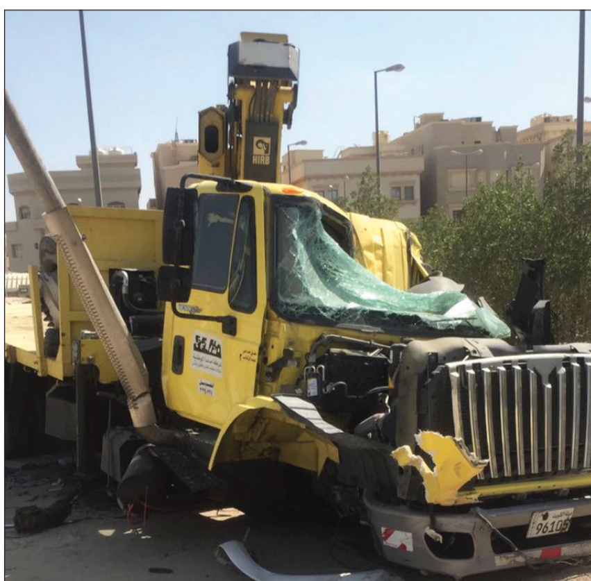
الكرين الذي استخدمه الإرهابي في تنفيذ العملية

وأوضحت أنه بعد التحقيقات الأولية من قبل الأجهزة الأمنية المختصة عثر بمركبة المتهم على ورقة بخط يده تشير إلى تبنيه فكر ما يسمى بتنظيم داعش الإرهابي ومبايعته لهذا التنظيم، وحرّام ومواد يشتهه في أنها مواد متفجرة تنبئ عن تخطيطه لعمل إرهابي. وأشارت الإدارة العامة للعلاقات والإعلام الأمني إلى أنه لم تلحق إي إصابات بالأميركيين من جراء الحادث، بينما أصيب المتهم بكسور نقل على إثرها للمستشفى في حراسة أمنية.