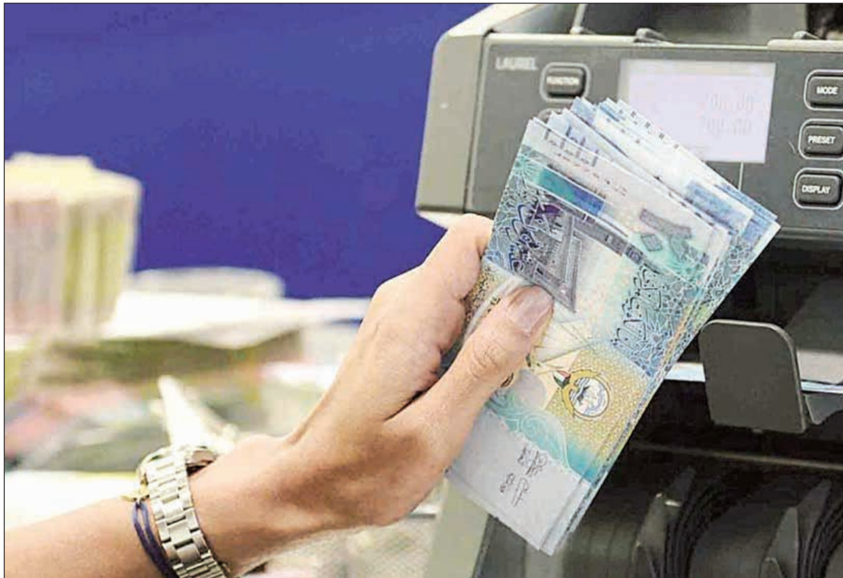
لا قروض جديدة لمتجاوزي مهلة «الفواتير» التي تؤيد استخدام القرض في الغرض الممنوح من أجله

التي توقع عليها العميل ما يلي: 1- الغرض من القرض على وجه التحديد. 2- مصدر سداد القرض (إذا لم يكن مصدر السداد هو الراغب، يتعين أن يحدد العميل المصادر الأخرى، التي سيتم من خلالها السداد). 3- المدة التي يطلب العميل سداد القرض من خلالها. 4- تعهد العميل بتقديم كافة المستندات التي يطلبها البنك، بما في ذلك الفواتير والمستندات التي تؤيد استخدام القرض في الغرض الممنوح من أجله. وفي حالة عدم التزام العميل بذلك، لا يتم منحه أي تسهيلات جديدة. 5- بيان القروض الاستهلاكية، وغيرها من القروض المقسطة، وكذلك الالتزامات المالية المشابهة القائمة، التي يكون العميل قد حصل عليها من البنوك، أو الشركات الأخرى الخاضعة لرقابة البنك، أو أي جهات أخرى.