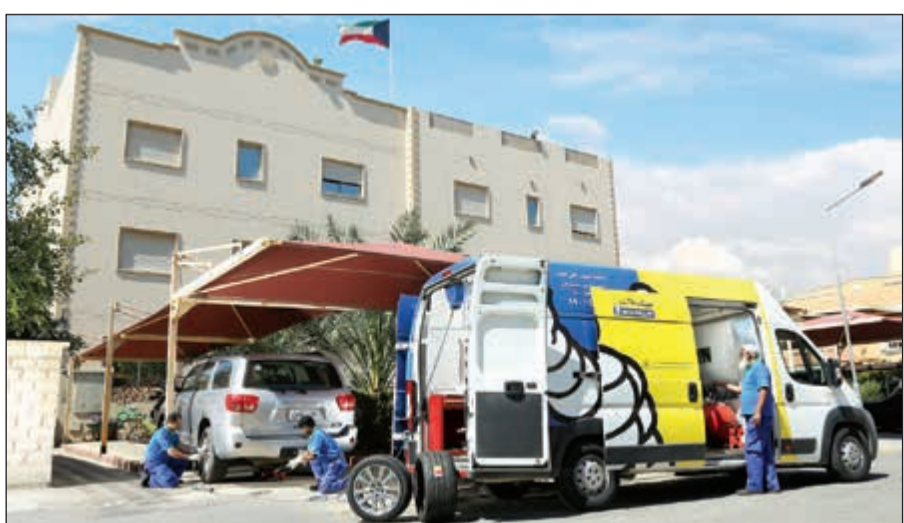
خدمة تبديل الإطارات أمام المنزل