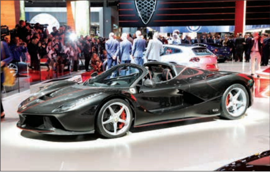
لافيراري أوبرتا ممهورة بشعار الاحتفالية

تنتهز فيراري فرصة معرض باريس للسيارات للإعلان عن مجموعة من المبادرات الخاصة باحتفالها بالذكرى السنوية السبعين لتأسيس فيراري والتي ستحل في شهر سبتمبر 2017.