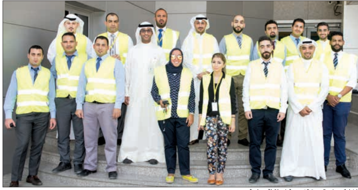
المشاركون في الدورة التدريبية في لقطة جماعية