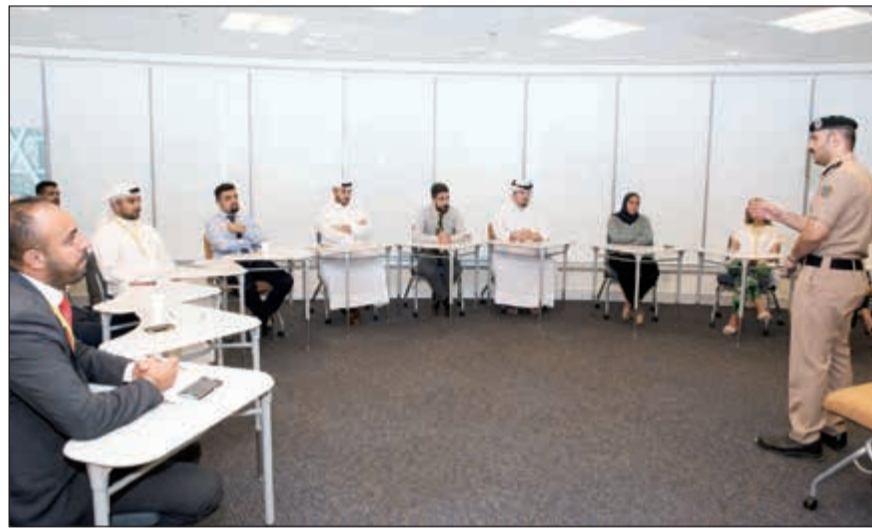
جانب من الدورة

المعلومات حول البنك الأهلي الكويتي، يرجى زيارة الموقع الإلكتروني www.eahli.com أو الاتصال بمركز خدمة العملاء «أهلا أهلي» على الرقم 1899899.