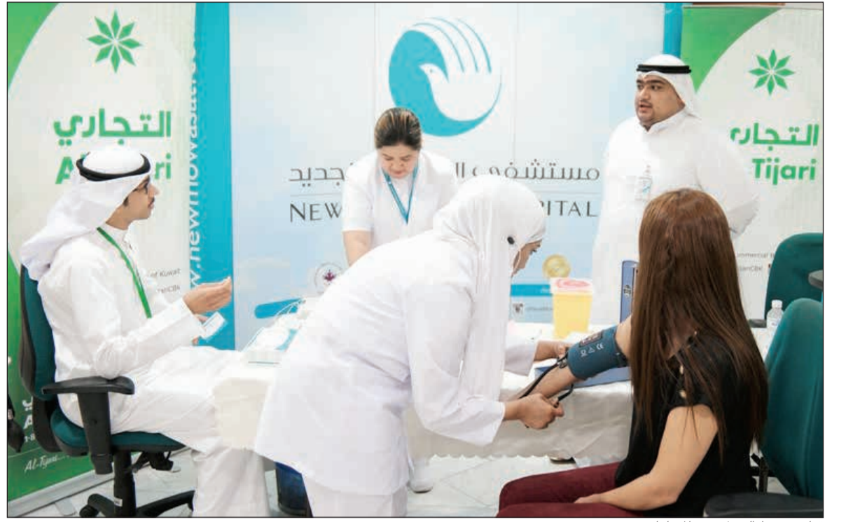
قياس ضغط الدم لأحدى الموظفات

من الاطمئنان على مستوى السكر والضغط ومستوى الأوكسجين بالدم، بالإضافة إلى قياس الطول والوزن، وأن هذه الفحوص دائماً يكون الإقبال عليها كبيراً من قبل الموظفين. وتابعت أماني الورع مديرة أن البنك كان قد استقبل الفريق الطبي لمستشفى المواساة الجديد في المركز الرئيسي واستكمل هذه الفعالية التوعوية الصحية باستقبال الفريق في مبنى البنك بحولي حيث توافد الموظفون لعمل الفحوص، والتأكد من قياس مستوى السكر في الدم وقياس ضغط الدم والحصول على