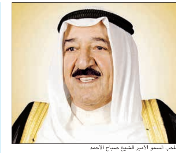
صاحب السمو الأمير الشيخ صباح الأحمد

بعث صاحب السمو الأمير الشيخ صباح الأحمد ببرقية تهنئة إلى أنطونيو غوتيريس وذلك بمناسبة ترشيحه بالإجماع من قبل مجلس الأمن أميناً عاماً للأمم المتحدة أعرب فيها سموه عن خالص تمنياته له بالتوفيق والسداد والمضي قدماً في استكمال مسيرة من سبقه بإرساء ما تتطلع إليه شعوب العالم من سلم وأمن دوليين ومضاعفة الجهود في تبني كل القضايا الإنسانية وما تواجهه من تحديات ونشر مبادئ العدالة والمساواة ورفع المعاناة عن المحتاجين في جميع دول العالم، مؤكداً سموه على أن