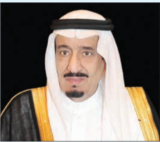
خادم الحرمين الشريفين الملك سلمان بن عبدالعزيز