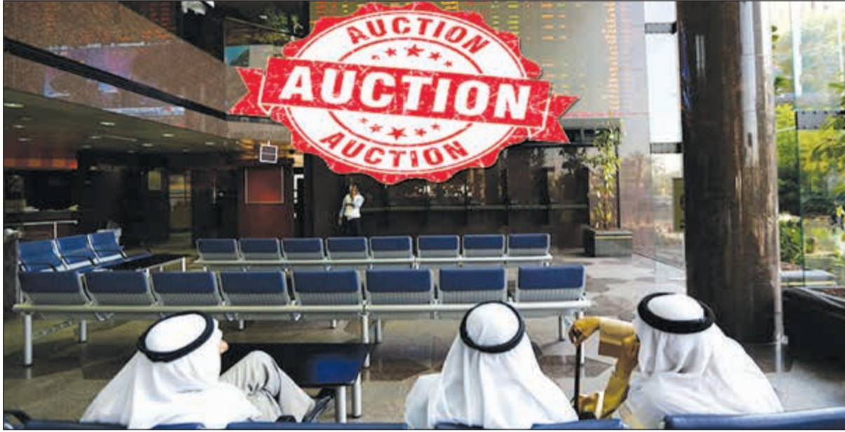
السوق يتبرق مزاد الصفقة الملبارية