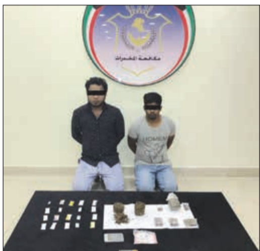
المتهمان وامامهم المضبوطات