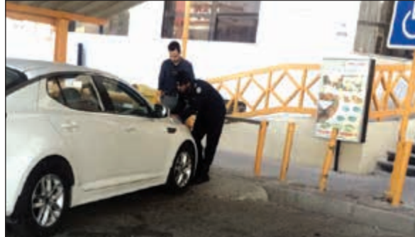
من حملة مخالفة مواقف المعاقين

وضبط وأفد لبناني تبين انه مدين بـ 5,125 ديناراً ومواطن من مواليد 1983 مطلوب لدين قدره 2100 دينار ومواطن مطلوب لدين قدره 4592 ديناراً.