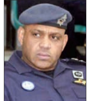
العميد صالح العنزي

امس الفروانية وفي فترة ما بعد منتصف الليل عدة حملات أمنية اسفرت عن ضبط عدد من المطلوبين، حيث ضبط مواطن مطلوب للسجن جنائيا بـ 7 أشهر ومدين بـ 11 ألف ديناراً.