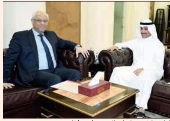
الرئيس الغانم مع السفير المصري ياسر عاطف

إنجازات وسعيهم لتحقيق المزيد من الأهداف بأنه خير مثال للرياضيين على عدم الاستسلام والياس. وأكد الغانم حرص