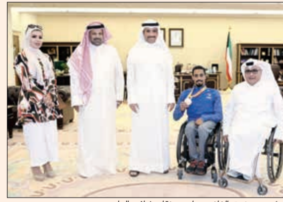
الرئيس مرزوق الغانم مع أحمد نقا وشافي الهاجري

أقيمت في (ريو دي جانيرو) بالبرازيل اللاعب أحمد نقا المطيري. وقال الغانم: إن أبناءنا من ذوي الاحتياجات الخاصة