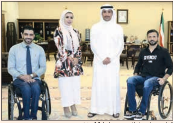
الغانم مع فيصل الموسوي وإسماعيل كمشاد

كما استقبل رئيس مجلس الأمة مرزوق الغانم في مكتبه أمس عدداً من السفراء المعتمدين لدى الكويت. والتقى الغانم كلا على حدة سفير جمهورية مصر العربية لدى البلاد ياسر عاطف، وسفير جمهورية ألمانيا الاتحادية كارل فريد بير غنر، وسفير جمهورية اليونان أندريس باباداكيس، وسفير جمهورية باكستان الإسلامية غلام دستجير، وسفير مملكة ماليزيا أحمد روزيان بن عبدالغني، وسفير جمهورية طاجيكستان زبيدالله زبيدوف. وجرى خلال اللقاءات استعراض العلاقات الثنائية التي تربط الكويت وتلك الدول وسبل تعزيز آفاق التعاون معها في شتى المجالات خاصة فيما يتعلق بالجانب البرلماني.