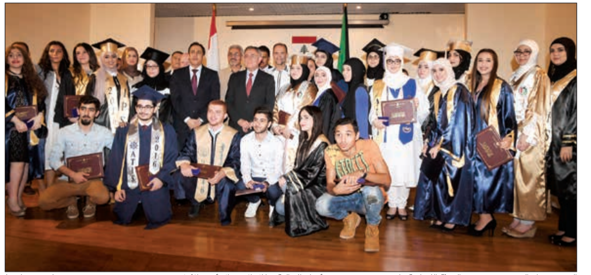
الرئيس فؤاد السنيورة ورئيس البعثة اللبنانية ماهر خير مع عدد من أفراد الجالية خلال الاحتفال أمس الأول

أكد الأمين العام للمجلس الوطني للثقافة والفنون والآداب م.علي اليوحة أن فوز سبعة حرفيين كويتيين بجائزة تحكيم مجلس الحرف العالمي للتميز الحرفي يؤكد مكانتهم المتقدمة بين نظرائهم من العالم. وشدد اليوحة في تصريحه للصحافيين عقب افتتاحه معرض القطع الفائزة بجائزة تحكيم مجلس الحرف العالمي للتميز الحرفي يوم أمس الأول في متحف الكويت الوطني على أهمية الحرف اليدوية وتسليط الضوء عليها بهدف ضمان استمرارها وتوارثها عبر الأجيال. وقال إن المجلس تلقى مشاركات عدة من أبناء الكويت بقطع مميزة صنعوها بأيديهم وفازت سبع مشاركات كويتية من أصل 19 مما يؤكد وجود عدد لا بأس به من المهتمين بالحرف اليدوية في الكويت موضحاً أن المعرض نتاج مشاركات فائزة من إقليم اسيا والباسيفيك. وذكر ان عدد المشاركات في الجائزة ككل بلغ نحو 248 قطعة مصنعة