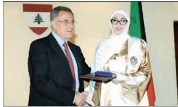
الرئيس فؤاد السنيورة مكرماً المتفوقة رندا حسام الشامي