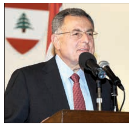
فؤاد السنيورة خلال لقائه كلمته

بهذا الاحتفال العائلي نجبر لكم عن مقدار تقديرينا لإنجازكم». وتابع: اليوم نكرم فيكم ما تملونه من عدوى إيجابية لزملاء آخرين لكم لتكونوا مثالا لهم في التميز وحتى تكون هذه العدوى مصدر دينامية في مجتمعنا اللبناني، «كما لا ننسى بهذا التكريم الجهد الذي بذله أهلكم في متابعتكم وتشجيعكم لتصلوا إلى ما وصلتم إليه اليوم». وأشار إلى أن الطلاب اليوم على عتبة مرحلة جديدة، نامل أن ينقلوا ما حصلوا عليه على المقاعد الدراسية إلى العمل أو إكمال المسيرة الدراسية بمقدار الجدية نفسها، مضيفاً «وأنا على ثقة بأن هذا العالم الجديد الذي نعيشه اليوم يتطلب الكثير من الجهد والجدية حتى نستطيع أن نتجح في مواجهة التحديات الكبرى».