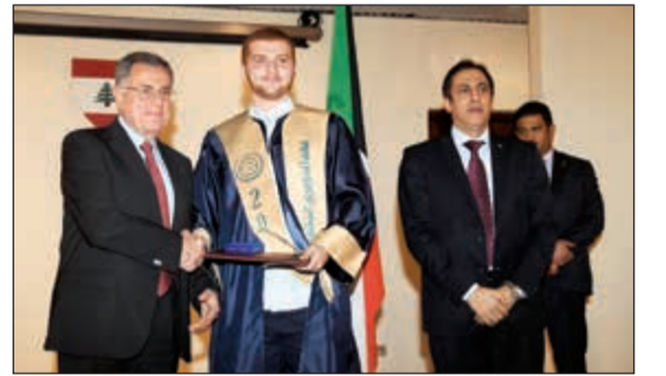
السنيورة مكرماً أحد الطلاب الفائزين