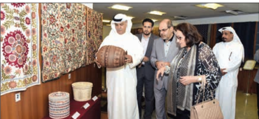
قطع فنية مميزة يرضها المعرض (ريليش كومار)

بدويا فإن منها نحو 118 قطعة صنعت بحرفية عالية، مشيراً إلى أن اختيار القطع الفائزة جاء عن طريق لجنة تحكيم حرفيين مجلس الحرف العالمي لإقليم آسيا والباسيفيك والتي اختارت أفضل القطع على مستوى اسيا المنتجات الحرف اليدوية. وأكد اليوحة أهمية بقاء هذه القطع الفائزة في الكويت لرضها على مدار السنة سواء في متحف الكويت الوطني أو في معارض تقام في بعض الأماكن العامة. وقال ان (جائزة التميز