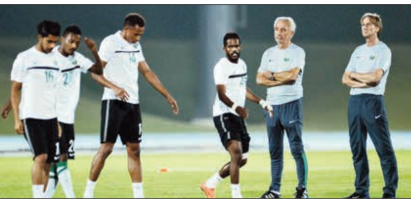
مدرب السعودية بيرت فان ماريك يتابع التدريبات

وسيطرت تصريحات جلو المثيرة على اجواء اللقاء بعد ان اطلق على المنتخب السعودي لقب «البانس» وأن أكبر طموحاته هو الخروج بنقطة واحدة. ويلعب المنتخب السعودي اليوم على أرضية ستاد الجوهرة المشعة في جدة اللقاء السابع له منذ افتتاحه في الأول من مايو 2013 ولم يسبق له ان خسر على أرضيته بعد ان كسب 5 مباريات وتعادل في السادسة. وحشد الاتحاد السعودي لكرة القدم كافة استعداداته للقاء اليوم وسط حضور جماهيري استنفذ جميع التذاكر المقررة والبالغة 60 ألف تذكرة سيشكلون دعماً معنوياً لـ«الأخضر» الذي يدخل لقاء اليوم وسط تكامل عناصره بعد ان انضم هدايف التصفيات محمد السهلاوي الى القائمة اثر شفائه من الإصابة، الا ان امر مشاركته بيد فان ماريك.