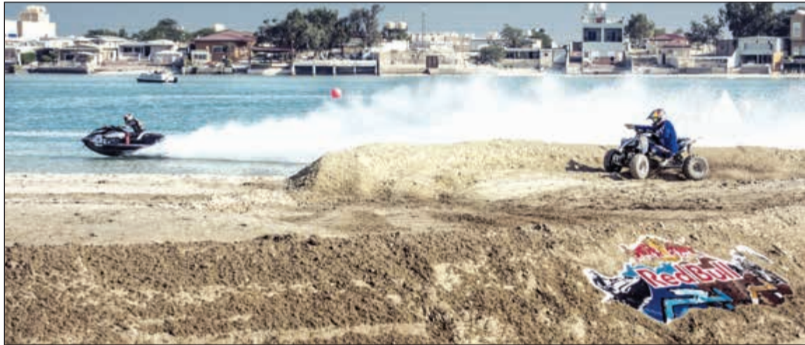
بطولة ريد بل بر بحر أقيمت للمرة الأولى في عام 2014

بعد النجاح الكبير الذي حققته قبل عامين، حين جمعت بين فئتين مختلفتين من رياضة المحركات في حدث فريد لم تشهد له الكويت مثيلاً من قبل، تعود بطولة «ريد بل بر بحر» من جديد لتضرب موعداً مع عشاق السرعة والمغامرة في 11 نوفمبر على شاطئ المارينا في منطقة السالمية وتقام عشية الحدث تصفيات تأهيلية في 10 نوفمبر لاختيار المشاركين في النهائي.