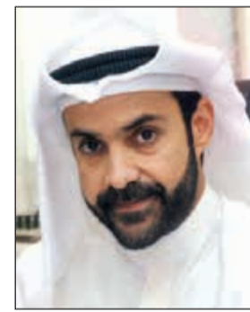
الشيخ طلال الصباح

ضمن توسعاتها التي تسير وفق خططها المدروسة من قبل مجلس الإدارة. وأضاف أن الشركة تسلمت برجي ليفلز السالبيه على الأساس الأسود قبل الموعد المحدد بن شهر، وذلك يؤكد أن الشركة تعمل وفق خطتها على أكمل وجه ضمن المدة الزمنية المحددة، لتبدأ الآن مرحلة التشطيب مطلع 2017 وهي المرحلة الأهم من جانب أن تتم مراقبة جودة العمل لتكون على أعلى مستوى من الاحترافية والدقة في عمليات التشطيب لتناسب رؤية إدارة الشركة حتى يكون البرجان من أعلى مستويات الرفاهية والفخامة.