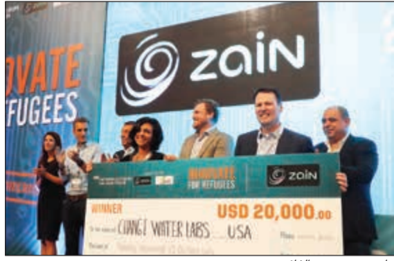
جانب من تتويج الفائزين