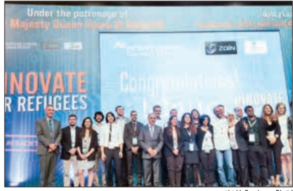
لقطة جماعية للفائزين