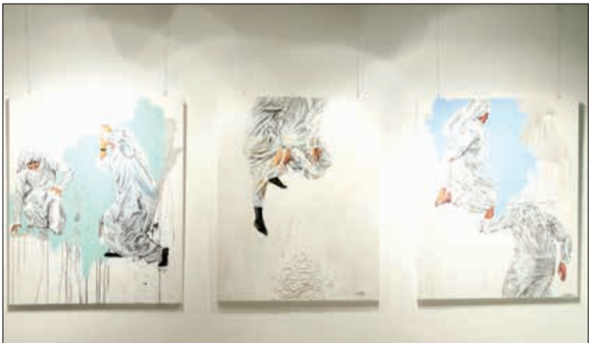
جانب من اللوحات الفنية للفنانة هي السعد في دار حمد

هذا، وقد لاقى المعرض استحساناً كبيراً من المقتنين الذين أقبلوا على اقتناء اللوحات الفريدة من نوعها، فالفنانة هي السعد عرفت بإبداعها وإتقانها وهو ما مكناها من الفوز بجائزة سمو الأمير الشيخ صباح الأحمد من مهرجان الإبداع التشكيلي، وجائزة المرأة العربية في الفنون، والعديد من الجوائز المحلية والعالمية الأخرى، فضلاً عن اقتناء العديد من المؤسسات والشخصيات المرموقة لأعمالها مثل: مركز الملك عبدالعزيز التاريخي بالرياض، وسمو الأمير خالد الفيصل، وسمو الأمير سلطان بن فهد الرئيس العام السابق لرعاية الشباب في المملكة العربية السعودية، والشيخ د.سلطان بن محمد القاسمي حاكم الشارقة، والديوان الأميري ومقتنيات خاصة داخل الكويت.