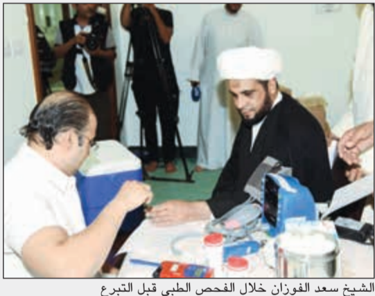
الشيخ سعد الفوزان خلال الفحص الطبي قبل التبرع