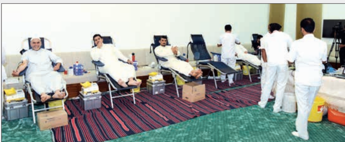
جانب من حملة التبرع