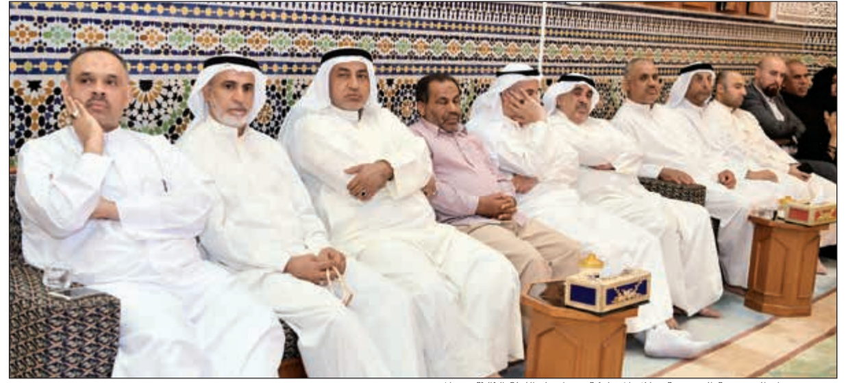
عدد من رواد الحسينية الجعفرية خلال المشاركة في إحياء الليلة الثالثة من الحرم