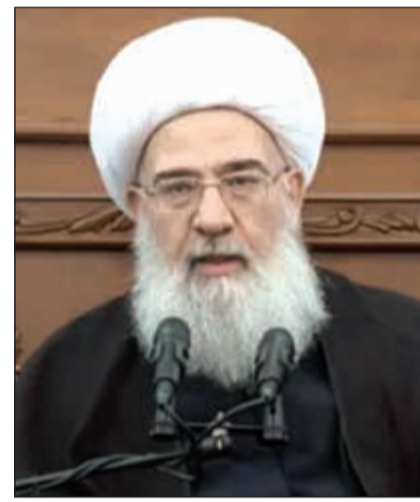
الشيخ د.فاضل المالكي