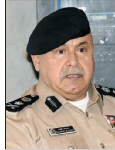
الفريق سليمان الفهد