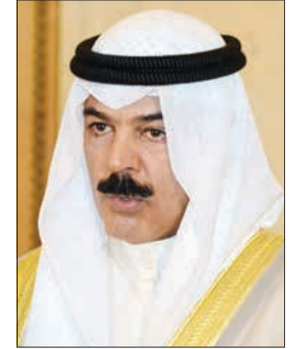
الشيخ محمد الخالد