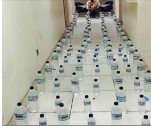
قناني الخمر المحلي