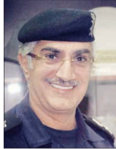
اللواء ابراهيم الطراح