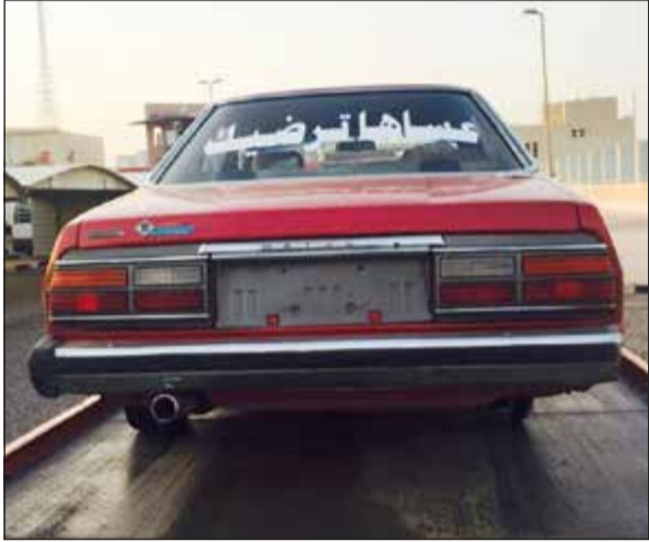
إحدى المركبات التي تم حجزها