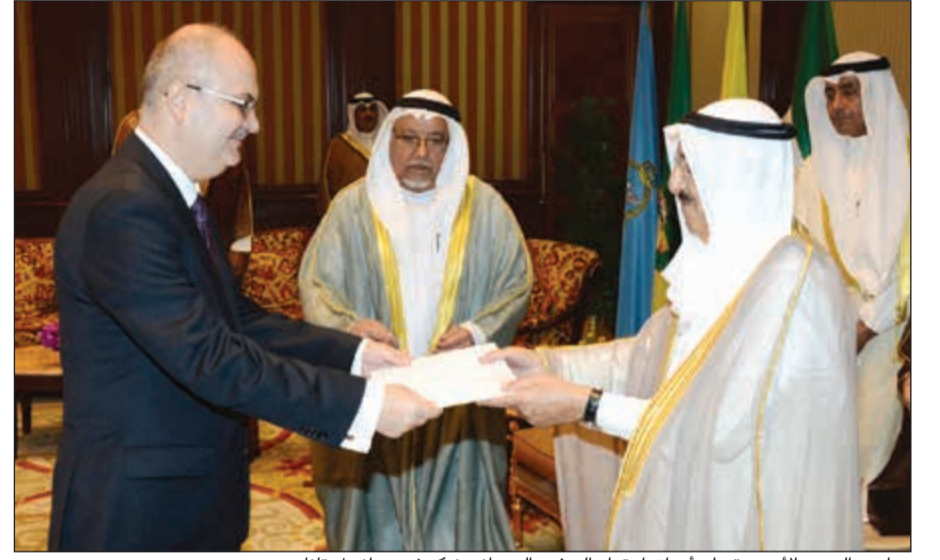
صاحب السمو الأمير يتسلم أوراق اعتماد السفير الروماني نيكوشور دانييل تاناسي

استقبل صاحب السمو الأمير الشيخ صباح الأحمد بقصر بيان صباح أمس سمو ولي العهد الشيخ نواف الأحمد. كما استقبل سموه بقصر بيان صباح أمس سمو رئيس مجلس الوزراء الشيخ جابر المبارك. واستقبل سموه بقصر بيان صباح أمس النائب الأول لرئيس مجلس الوزراء ووزير الخارجية الشيخ صباح الخالد. إلى ذلك، احتفل في قصر بيان صباح أمس بتسليم صاحب السمو الأمير الشيخ صباح الأحمد أوراق اعتماد كل من السفير لورانس روبرت سيلفاران سفيراً للولايات المتحدة الأميركية والسفير نيكوشور دانييل تاناسي سفيراً لجمهورية رومانيا والسفير يان نيسيلف سفيراً لمملكة السويد وذلك كسفراء لبلادهم لدى الكويت. حضر مراسم الاحتفال النائب الأول لرئيس مجلس الوزراء ووزير الخارجية الشيخ صباح الخالد ونائب وزير شؤون الديوان الأميري الشيخ علي الجراح ووكيل الديوان الأميري إبراهيم حمد الشطي ومدير مكتب صاحب السمو الأمير السفير أحمد فهد الفهد والمستشار في الديوان الأميري محمد أبو الحسن ورئيس المراسم والتشريعات الأميرية الشيخ خالد العبدالله ومساعد وزير الخارجية لشؤون المراسم السفير ضاري العجران وأمر الحرس الأميري العميد ركن فهد عبدالرحمن الزيد.