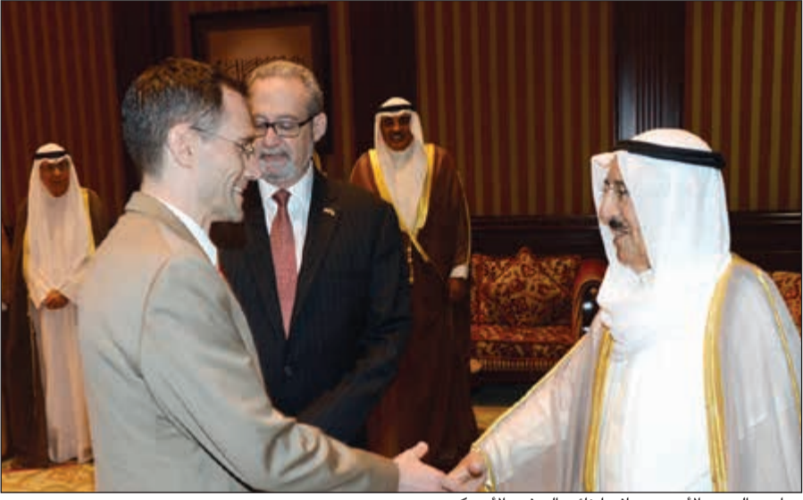
صاحب السمو الأمير مصافحا نائب السفير الأميركي

استقبل صاحب السمو الأمير الشيخ صباح الأحمد بقصر بيان صباح أمس سمو ولي العهد الشيخ نواف الأحمد. كما استقبل سموه بقصر بيان صباح أمس سمو رئيس مجلس الوزراء الشيخ جابر المبارك. واستقبل سموه بقصر بيان صباح أمس النائب الأول لرئيس مجلس الوزراء ووزير الخارجية الشيخ صباح الخالد. إلى ذلك، احتفل في قصر بيان صباح أمس بتسليم صاحب السمو الأمير الشيخ صباح الأحمد أوراق اعتماد كل من السفير لورانس روبرت سيلفاران سفيراً للولايات المتحدة الأميركية والسفير نيكوشور دانييل تاناسي سفيراً لجمهورية رومانيا والسفير يان نيسيلف سفيراً لمملكة السويد وذلك كسفراء لبلادهم لدى الكويت. حضر مراسم الاحتفال النائب الأول لرئيس مجلس الوزراء ووزير الخارجية الشيخ صباح الخالد ونائب وزير شؤون الديوان الأميري الشيخ علي الجراح ووكيل الديوان الأميري إبراهيم حمد الشطي ومدير مكتب صاحب السمو الأمير السفير أحمد فهد الفهد والمستشار في الديوان الأميري محمد أبو الحسن ورئيس المراسم والتشريعات الأميرية الشيخ خالد العبدالله ومساعد وزير الخارجية لشؤون المراسم السفير ضاري العجران وأمر الحرس الأميري العميد ركن فهد عبدالرحمن الزيد.