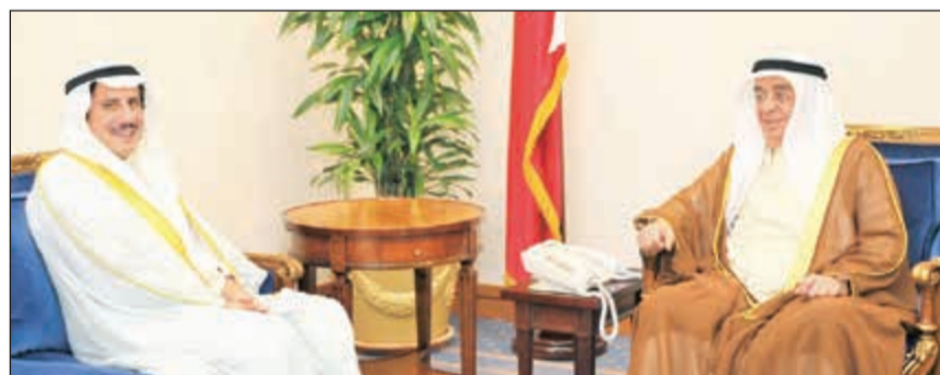
نائب رئيس الوزراء البحريني الشيخ محمد بن مبارك آل خليفة مستقبلا الشيخ عزام الصباح

المنامة - كونا: أشاد نائب رئيس مجلس الوزراء البحريني الشيخ محمد بن مبارك آل خليفة بمساعي صاحب السمو الأمير الشيخ صباح الأحمد الخيرة في المحافل الدولية بما يخدم السلام والاستقرار.