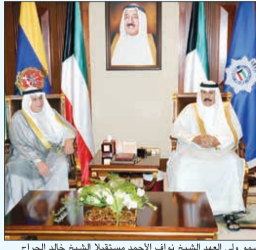
سمو ولي العهد الشيخ نواف الأحمد مستقبلا الشيخ خالد الجراح

استقبل سمو ولي العهد الشيخ نواف الأحمد بقصر بيان صباح أمس سمو رئيس مجلس الوزراء الشيخ جابر المبارك.