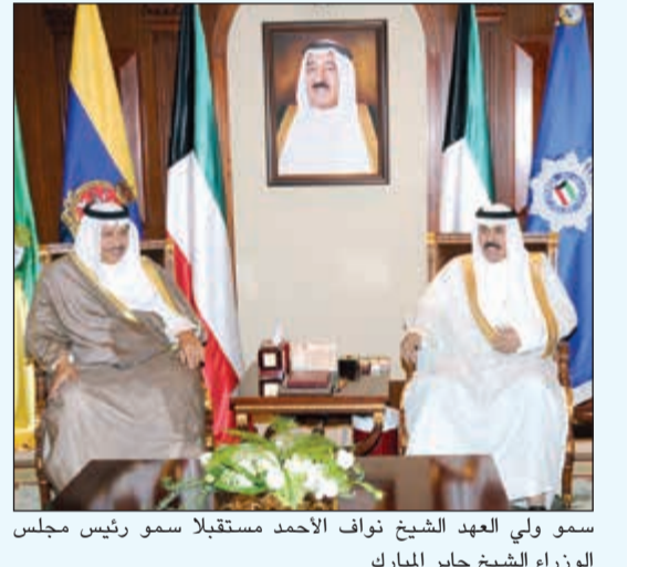
سمو ولي العهد الشيخ نواف الأحمد مستقبلا سمو رئيس مجلس الوزراء الشيخ جابر المبارك

واستقبل سموه بقصر بيان صباح أمس النائب الأول لرئيس مجلس الوزراء ووزير الخارجية الشيخ صباح الخالد. واستقبل سمو ولي العهد بقصر بيان صباح أمس نائب رئيس مجلس الوزراء ووزير الداخلية الشيخ محمد الخالد. كما استقبل سمو ولي العهد بقصر بيان صباح أمس نائب رئيس مجلس الوزراء ووزير الدفاع الشيخ خالد الجراح.