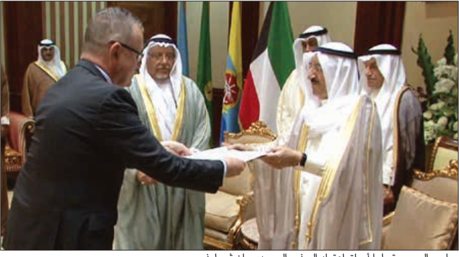
صاحب السمو متسلما أوراق اعتماد السفير السويدي يان نيسيلف