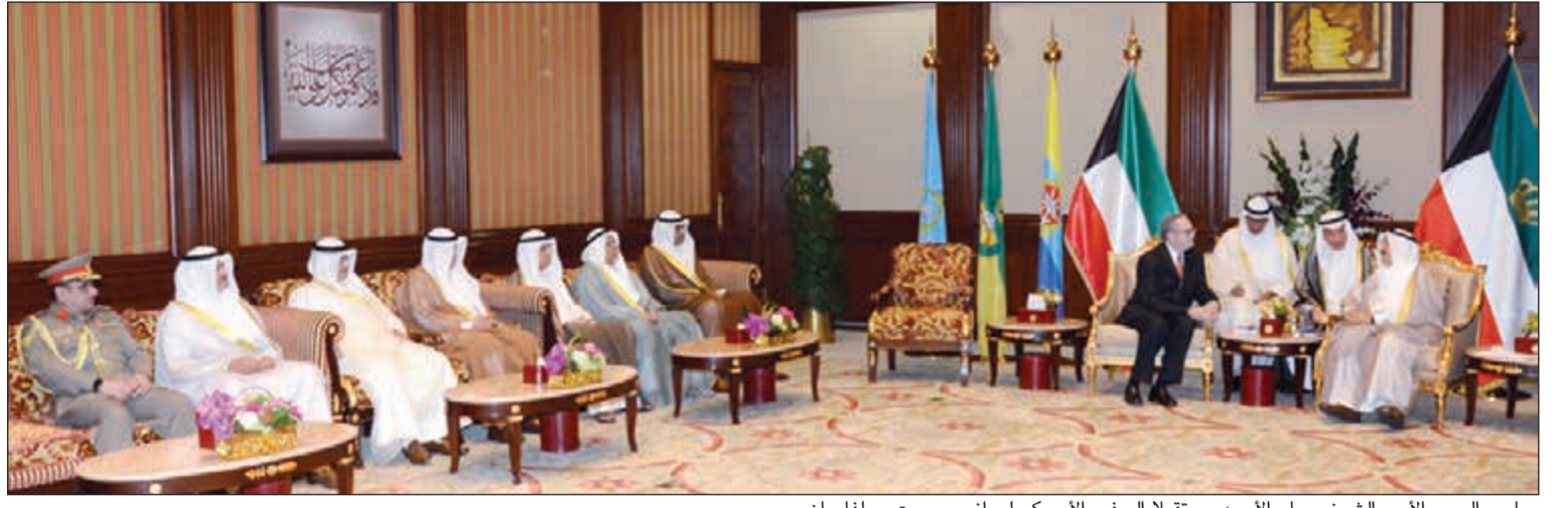
صاحب السمو الأمير الشيخ صباح الأحمد مستقبلا السفير الأميركي لورانس روبرت سيلفاران