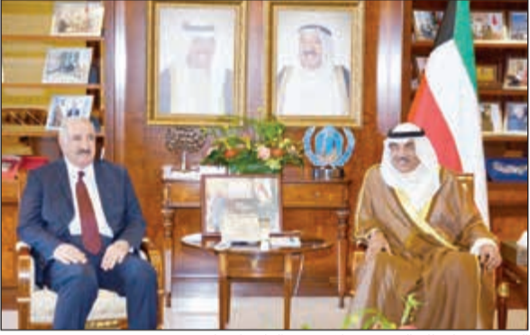
الشيخ صباح الخالد مستقبلا د. عبدالباسط تركي سعيد

وحضر اللقاء الذي عقد في مقر ديوان عام وزارة الخارجية كل من نائب وزير الخارجية السفير خالد الجارالله ومدير عام الصندوق الكويتي للتنمية الاقتصادية العربية عبد الوهاب البدر ومساعد وزير الخارجية لشؤون الوطن العربي السفير عبدالعزيز الديحاني ومساعد وزير الخارجية لشؤون مكتب النائب الأول لرئيس مجلس