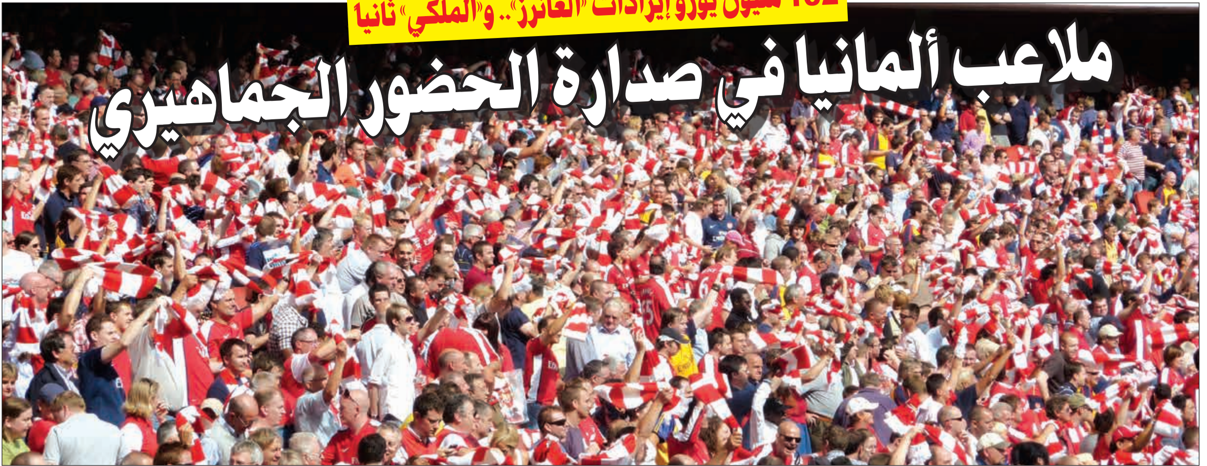
جماهير أرسنال الكبيرة

4- أولاد ترانفورد (مان يونايتد) 114 مليون يورو. 5- ستامفورد بريدج (تشلسي): 93.1 مليون يورو. 6- أليانز أرينا (بايرن ميونيخ) 89.8 مليون يورو. 7- بارك دي برانس (باريس سان جرمان) 78 مليون يورو. 8- أنفيلد رود (ليفربول): 75 مليون يورو. 9- سينفال (مان سيتي): 57 مليون يورو. 10- سينفال أيدونا بارك (دورتموند): 54.2 مليون يورو.