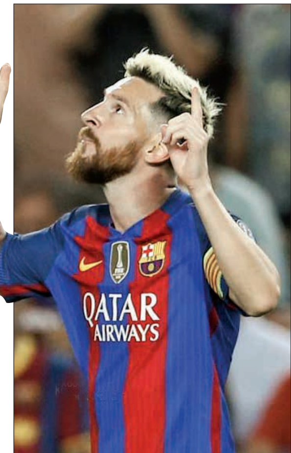
البرغوث الأرجنتيني ميسي

وجاء البرازيلي نيمار، في المركز الرابع، بمساهمته في (49 هدفاً)، حيث سجل 26 هدفاً، وصنع 23 هدفاً، فيما جاء البرتغالي كريستيانو رونالدو نجم ريال مدريد، في المركز الخامس، بمساهمته في (47 هدفاً)، حيث سجل 35 هدفاً، وصنع 12 آخرين.