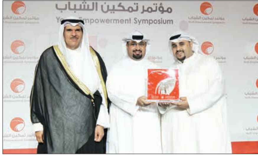
الشيخ سلمان الحمود مكرماً «زين»

أعلنت شركة زين عن شراكتها الاستراتيجية للمشروع الوطني الأكاديمي «تمكين الشباب» للسنة الخامسة على التوالي، وذلك خلال أنشطة حفل الافتتاح والذكرى السنوية الخامسة الذي تخلله تكريم الشركة بحضور ممثل صاحب السمو الأمير الشيخ صباح الأحمد وزير الدولة لشؤون الشباب ووزير الدولة للإعلام الشيخ سلمان الحمود.