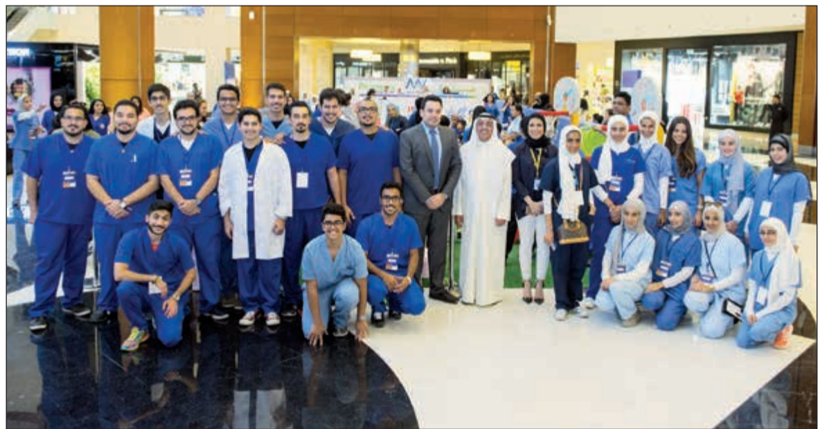
متطوعون من كليات مقدمي الرعاية الصحية في الكويت شاركوا في الحملة

إلى إيمانه الراسخ بأهمية دعم الشباب الكويتي في مختلف التخصصات وتعزيز دورهم من خلال مشاركتهم في نشاطات مجتمعية هادفة، ما يسهم بدوره في توسيع آفاق فهمهم لمهنة الطبيب وما تتطلب هذه الرسالة النبيلة من تعاطف ومعرفة ليصبح برنامج «مستشفى تيدي بير» للأطفال فرصة إطلاق العنان لمخيلات الأطفال واستخدامها لوصف المرض أو الإصابة التي يعاني منها «دب صغير»، والتعرف على محيط المستشفى في بيئة مرحبة تثقيفية، وذلك تحت إشراف مجموعة من المتطوعين من مركز العلوم الصحية التابع لجامعة الكويت.