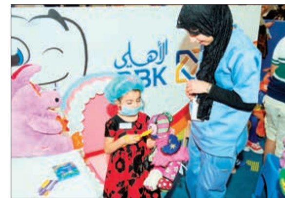
جانب من تفاعل الأطفال مع متطوعي الحملة

محاكاة العلاج ومتطلباته على «دب صغير» ويكون مختلف التخصصات وتعزيز دورهم من خلال مشاركتهم في نشاطات مجتمعية هادفة، ما يسهم بدوره في توسيع آفاق فهمهم لمهنة الطبيب وما تتطلب هذه الرسالة النبيلة من تعاطف ومعرفة ليصبح برنامج «مستشفى تيدي بير» للأطفال فرصة إطلاق العنان لمخيلات الأطفال واستخدامها لوصف المرض أو الإصابة التي يعاني منها «دب صغير»، والتعرف على محيط المستشفى في بيئة مرحبة تثقيفية، وذلك تحت إشراف مجموعة من المتطوعين من مركز العلوم الصحية التابع لجامعة الكويت.