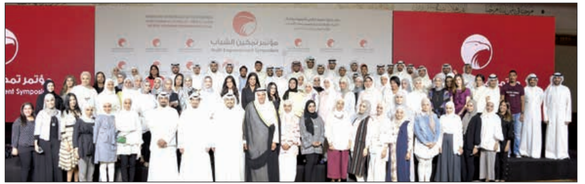
صورة جماعية للحضور

دعماً للمبادرات الشبابية التي تخدم المجتمع، رعى البنك الأهلي الكويتي الحملة الطبية التطوعية «مستشفى تيدي بير» التي قام بتنظيمها أكثر من 270 متطوعاً من كليات مقدمي الرعاية الصحية في الكويت، والتي استضافها مول 360 من فترة 29 إلى 1 أكتوبر 2016. وتأتي ضمن إطار مبادرات مجموعة «الأكاديمية» التطوعية لخدمة المجتمع بشكل عام، وفئة الأطفال بشكل خاص، حيث تهدف هذه الحملة إلى إزالة خوف الأطفال والرهبة من زيارة الطبيب، والسعي إلى تغيير مفهوم الطفل عن زيارة الطبيب من خلال