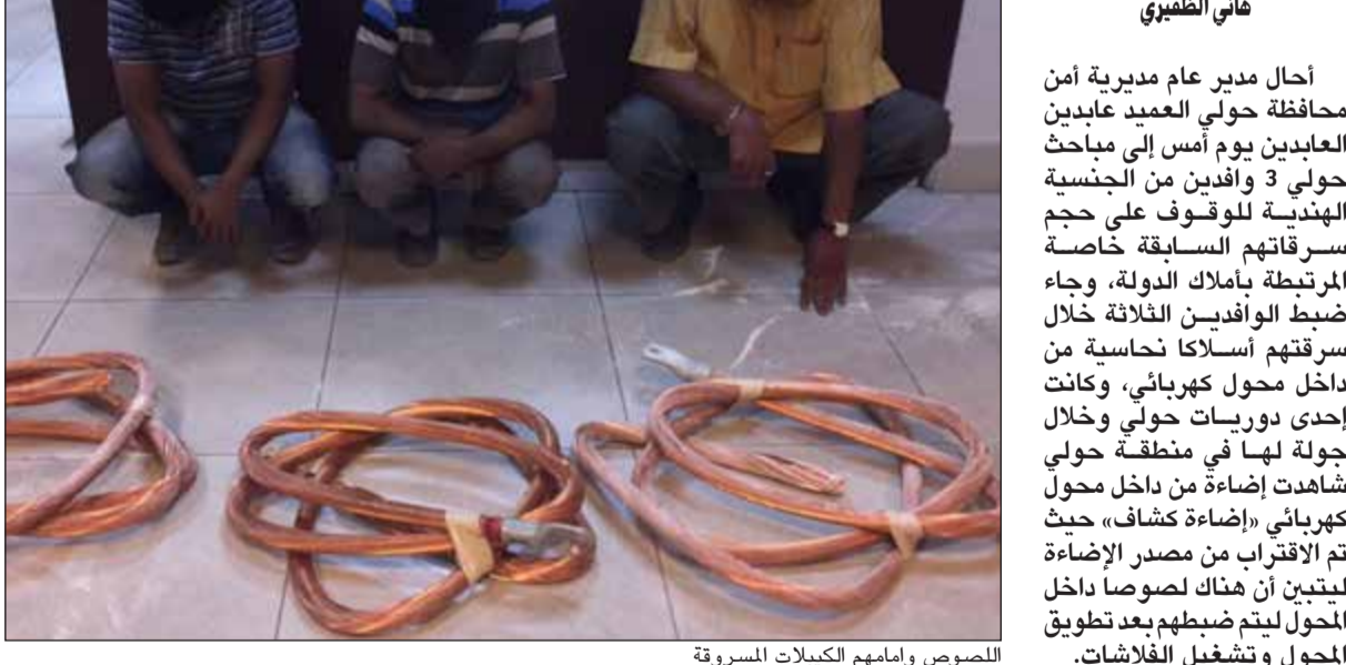
المحاصر وامامهم الكيبالات المسروقة