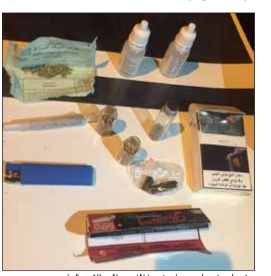
مخدرات ضبطت مع أردني خلال حملات الامن العام

عبدالله سقاح إلى إدارة التنفيذ المدني مواطنة تبين أنها مدينة بمبلغ 18 ألف دينار، وقال مصدر امني أن المدينة مطلوبة أيضاً لقضية خيانة امانة، كما أحيل أيضاً مدين وهو «خليجي الجنسية»، حيث أنه مدين بمبلغ 26 ألفا. وعلى صعيد آخر، ألقى رجال سرية المهام الخاصة القبض على مواطنة عثر بحوزتها على مخدر «لاريكا» ومواطن بمخدر الكيمكال وأردني بحشيش ومواطن مطلوب للسجن 5 أعوام.