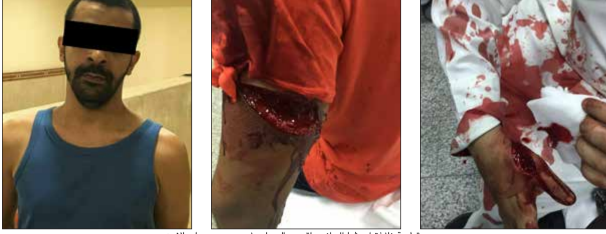
جروح قلعية نافذة أحدثها الجنائي «اقصى اليسار» في جسدي رجلي الامن

موقع الحادث حاول الهرب ولدى محاولاتهم ضبطه لم يمض وقت طويلاً، وسارع بإخراج سكين كانت بحوزته، وقام بطعنهما محاولاً الهرب، ولكنهما استطاعا السيطرة عليه واقتياده الى المخفر. وزادت: أن رجلي الامن أدخل المستشفى لتلقي العلاج اللازم وتمت مغادرة أحدهما إلا أن الآخر ما زال يتلقى العلاج داخل المستشفى وحالته الصحية مستقرة.