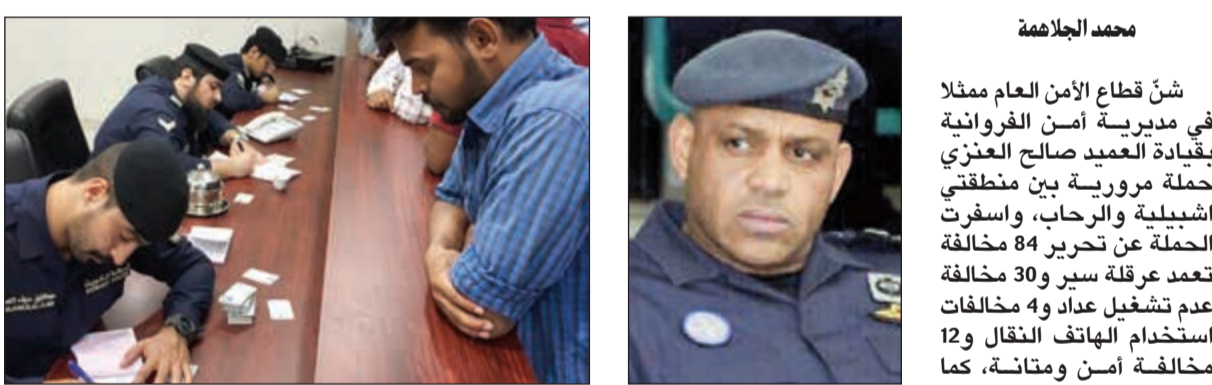
مخالف بانتظار تسلم اوراق المخالفة المحررة له