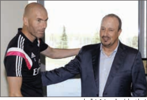
زيدان عادل رقم بينيتيز السلبى

أدى سقوط العملاق الإسباني ريال مدريد في فخ التعادل 1-1 مع مضيفه إيبسار الى فقدان صدارة الليغا لصالح جاره اللدود أتلتيكو مدريد. وبالإضافة الى ذلك عادل الفرنسي زين الدين زيدان، المدير الفني للنادي الملكي، نفس البداية التي حققها سلفا الإسباني رافا بينيتيز، بحصد 15 نقطة من أول 7 مباريات في الليغا، بتحقيق الفوز في المباريات له الأولى على حساب كل من: ريال سوسبيداد، سيلتا فيغو، أوساسونا وإسبانيول، قبل أن يدخل في دوامة التعادلات ليخطف بـ 3 نقاط فقط من مباريات فياريال، لاس بالماس وإيبسار الأخيرة. وبهذا يكون زيزو في منطقة الخطر، إذ أدت تلك النتائج إلى إقالة بينيتيز وتعيين الأول أواخر يناير الماضي، بالرغم من تحقيق رافا نفس النتائج في الجولات الـ 7 الأولى من الليغا، بالفوز في مبارياته الـ 4 الأولى أمام كل من: ريال بيتيس، إسبانيول، غرناطة وأتلتيك بلباو، قبل أن يقع في فخ التعادل مع كل من: سبورتنغ خيخون، ملقا وأتلتيكو مدريد، مسجلا هدفا أقل مما سجله البلاتكوس مع زيدان، ومحافظا على صلاية دفاعه باستقبال 5 أهداف أقل. وإذا ما أضفنا التعادل الأخير للريال مع بورتوسيا دورتموند مؤخرا في دوري الأبطال، فقد نشهد دخول زيزو في أزمة حقيقية، إلا إذا نجح في تدارك الأخير سريعا قبل فوات الأوان، خصوصا في ظل تعثر غريمه التقليدي برشلونة، والذي يمر بأزمة نتائج بدوره جعلته يحتل المركز الـ 4 حتى الآن خلف الريال بنقطتين.