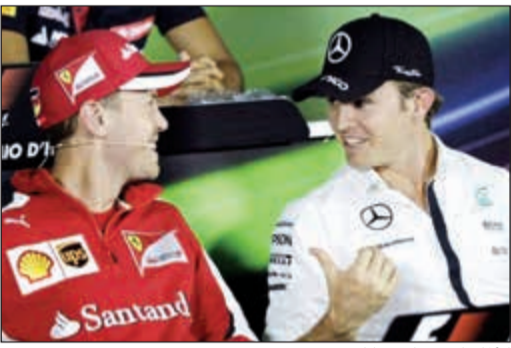
الألمانيان..صافي يا لين

تقدم الألماني سيبستيان فيتيل سائق فيراري بالاعتذار إلى مواطنه نيكو روزبرغ سائق مرسيدس بعدما اصطدم بسيارته في بداية سباق الجائزة الكبرى الماليزي ضمن منافسات بطولة العالم لسباقات سيارات فورمولا 1. واصطدم فيتيل مع روزبرغ لدى محاولة تجاوزه في المنعطف الأول بالسباق، وهو ما تسبب في تراجع روزبرغ. وقال روزبرغ في مقابلة فيديو نشره بموقع «يوتيوب»: «سيبستيان اتصل بي هاتفيا وابتعد، وهو أمر لطيف منه.. هذا لا يعيد لي النقاط التي فقدتها ولكنه لا يزال أمرا لطيفا منه». وأعلن مراقبو السباق أن فيتيل ارتكب «خطأ بسيطا» تسبب في التصادم. وسيعاقب فيتيل (29 عاما) بالتراجع ثلاثة مراكز خلال الانطلاق في سباق الجائزة الكبرى الياباني المقرر يوم الأحد المقبل.