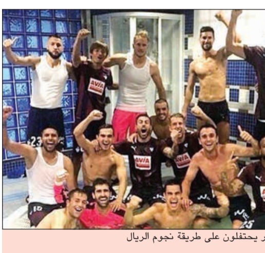
لاعبو إيبسار يحتفلون على طريقة نجوم الريال

«اليوثي» يراقب فيتسل اعترف المدير العام ليوغنتوس جوزيبي ماروتا أن ناديه سيسمي للتوقيع مع أكسيل فيتسل سواء في شهر يناير المقبل أو في سوق الانتقالات الصيفي التالية، وذلك في ظل انتهاء عقده مع فريقه زينيت سان بطرسبورغ بنهاية الصيف المقبل. وقال ماروتا - «راديو أنكيو سبور»: «لدينا التزام بمتابعة كل اللاعبين. فيتسل هو وضع أسهل، ميسر بفضل انتهاء عقده. سنحاول أخذه في يناير أو يونيو، مضيفا: «نقطة البداية بالنسبة لنا هي الدفاع. علينا أن نقدم أفضل ما لدينا. لقد حسنا الفريق والنادي نما كثيرا».