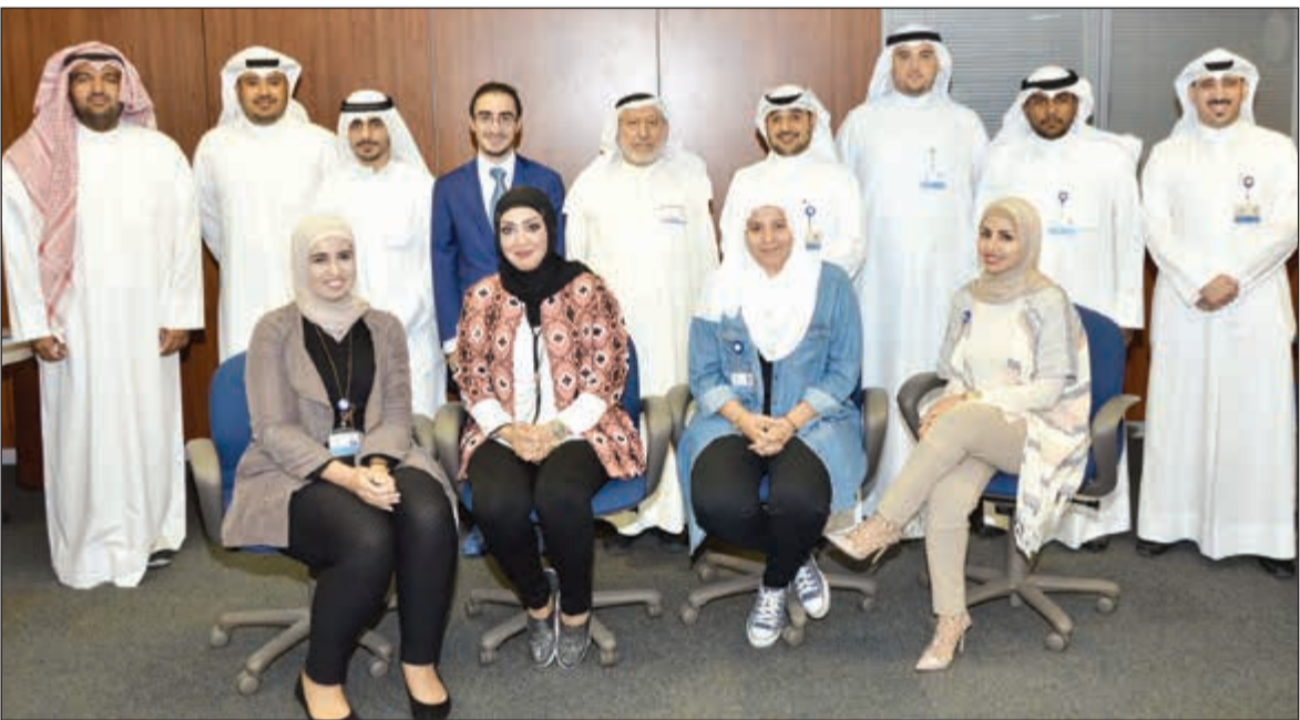
الموظفون المشاركون في الدورة