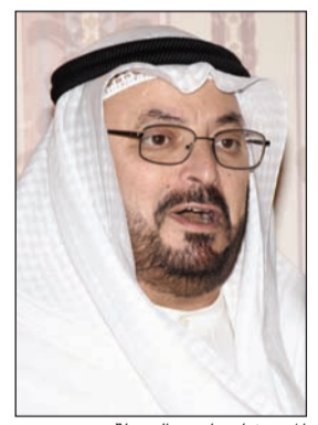
المستشار ناصر الدولية