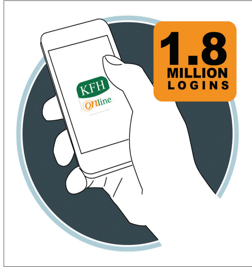
خدمات «بيتك» الإلكترونية

بلغ عدد عمليات تسجيل الدخول Log in التي أجراها عملاء بيت التمويل الكويتي «بيتك» على تطبيق «بيتك» أون لاين KFHOnline على أجهزة الأندرويد والابل، وكذلك عبر الموقع الإلكتروني للبنك kfh.com نحو 1,8 مليون عملية خلال شهر أغسطس الماضي، الأمر الذي يعكس كفاءة التطبيق ومرونته وتنوع الخدمات الإلكترونية المصممة لتلبية كل احتياجات العملاء على مدار الساعة وفق أعلى معايير السهولة والأمان. وتوزعت عمليات تسجيل الدخول بنحو 1,08 مليون على الأجهزة المدعومة بنظام الـ iOS، ونحو 304 آلاف أندرويد، ونحو 230 ألفاً على أجهزة الحاسب الآلي، ونحو 186 ألفاً على متصفحات الهواتف والأجهزة اللوحية «Tablets»، فيما تنوعت الأغراض من عمليات تسجيل الدخول لتشمل الاستعلام عن الرصيد، والعمليات الإلكترونية على كشف الحساب، وإضافة مستفيد، وإضافة خدمة الرسائل النصية التي تزود العملاء بتفاصيل معاملاتهم وأي تحديثات تطرأ عليها، وإضافة مستفيد خارجي، وتغيير كلمة السر، وعمليات التبرع للجان الخيرية، وطلب دفتر شيكات، والاستعلام عن الأقساط التجارية، ودفع الأقساط، وفتح وبيعة، وأوامر الدفع (الاستقطاعات)، والاشتراك بخدمات 3D Secure، والتحويل لحساب طرف آخر، والتحويل بين الحسابات الشخصية، والتحويل لحساب تجاري، والدفع الآلي وتفعيل بطاقة الصرف الآلي وبطاقات سبقة الدفع الإلكترونية، والاستعلام عن تفاصيل العمليات على البطاقة الائتمانية وتعبئتها، وطلب بطاقة