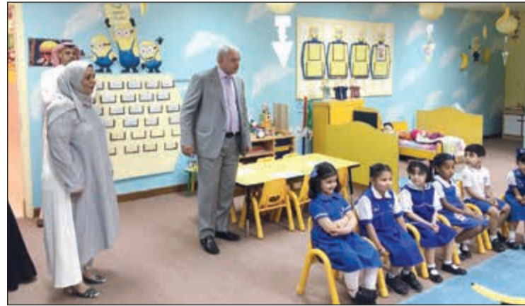
جانب من جولة العيسى على مدارس الجهراء