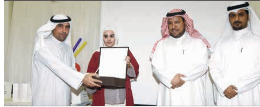
تكريم إحدى الفائقات (محمد هاشم)