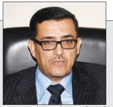
السفير اليمني د. علي بن سفيان

4 قوائم في انتخابات طلبة جامعة الكويت اليوم بعد اعتذار «المدنية» 18