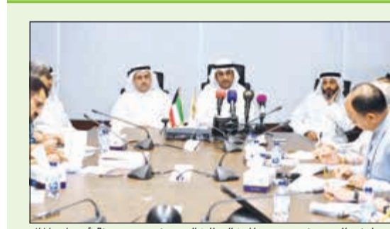
د. نايف الحجرف متوسلا خالد الخالد ومفوضي هيئة أسواق المال في المؤتمر الصحافي أمس

مريم بنديق يعقد مجلس الوزراء اجتماعه بعد ظهر اليوم مستبقا الاجتماع الحكومي - النيابي المرتقب لتقريب وجهات النظر حول مضي الحكومة في إجراءات الإصلاح الاقتصادي والمالي وترشيد دعم البنزين «ودراسة دعوى أخرى» حفاظا على مصلحة البلاد الاقتصادية العليا بالحفاظ على قوة وتمتانة الاقتصاد الكويتي وعدم تذبذب سعر الدينار وسط العملات الأخرى وتقليص ارتفاع نسبة