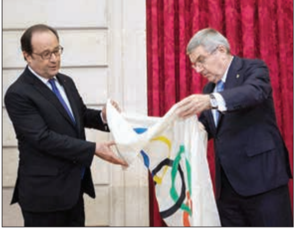
الرئيس الفرنسي هولاند يهدي توماس باخ علم دورة 1924 التي استضافتها فرنسا آنذاك

أعرب رئيس اللجنة الأولمبية الدولية الألماني توماس باخ عن «إعجابِه وتأثره» بوحدة الرياضيين الفرنسيين خلف ملف ترشيح مدينة باريس لاستضافة دورة الألعاب الأولمبية الصيفية عام 2024.