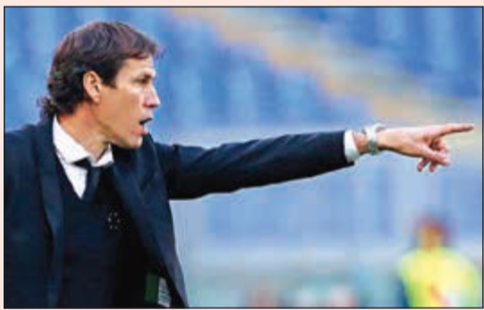
مدرب روما السابق غارسيا

مانشيني المدير الفني السابق لإنتر ميلان الإيطالي، هما أبرز المرشحين حتى الآن لتولي المهمة. وكان غارسيا قريب من العمل في البريميرليغ هذا الموسم، حيث كان ضمن