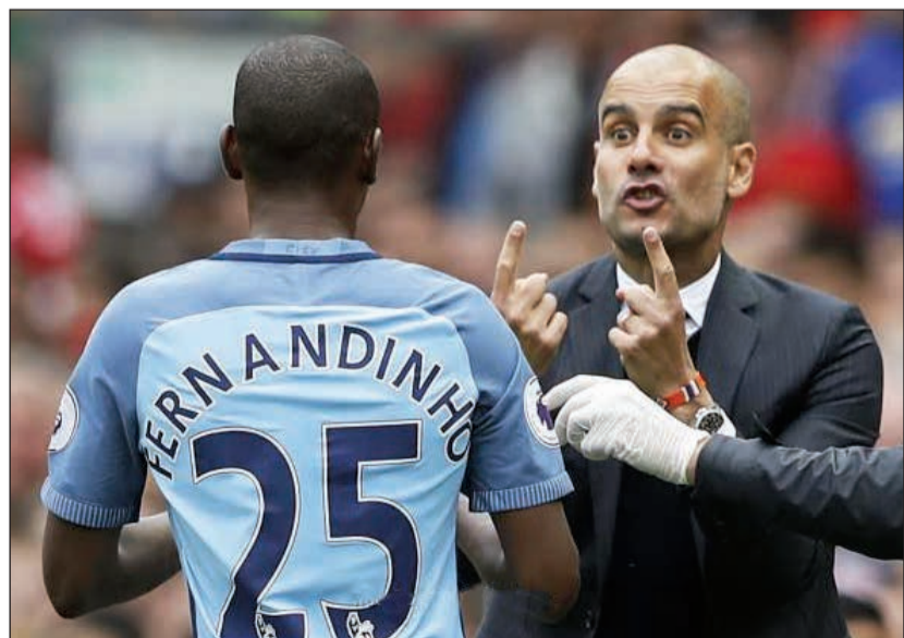
الاسباني يوجه البرازيلي المتوجح

وأضاف المدرب الإسباني «فرناندينو لاعب سريع وذكي كما يتميز بالقوة في الالتحامات الهوائية، يمكنه أن يلعب في عدة مراكز». وتابع غوارديولا «إذا امتلك الفريق 3 لاعبين مثل فرناندينو، فسننتج أبطالا للبريميرليغ، نحن نمتلك منه واحدا فقط، وهو مهم جدا لنا».