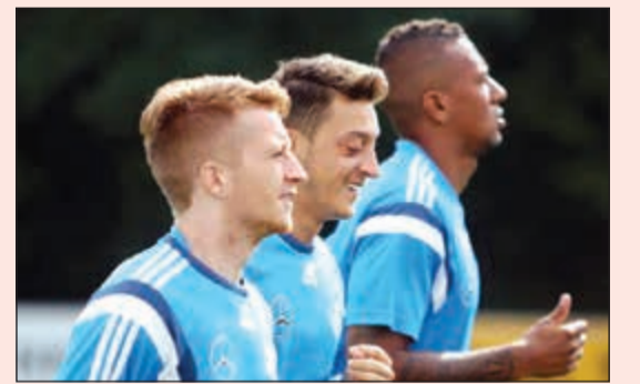
هل يخرج الرسام وياتي الفنان؟

يستعد أرسين فينغر المدير الفني لأرسنال الإنجليزي، للتعاقد مع نجم بوروسيا دورتموند ماركو رويس، لتعويض رحيل مواطنه الألماني مسعود أوزيل عن صفوف المدفعية. ووفقا لما نشره موقع «ترانسفير ماركيت ويب»، يرغب أوزيل في الرحيل عن صفوف الفريق الإنجليزي في