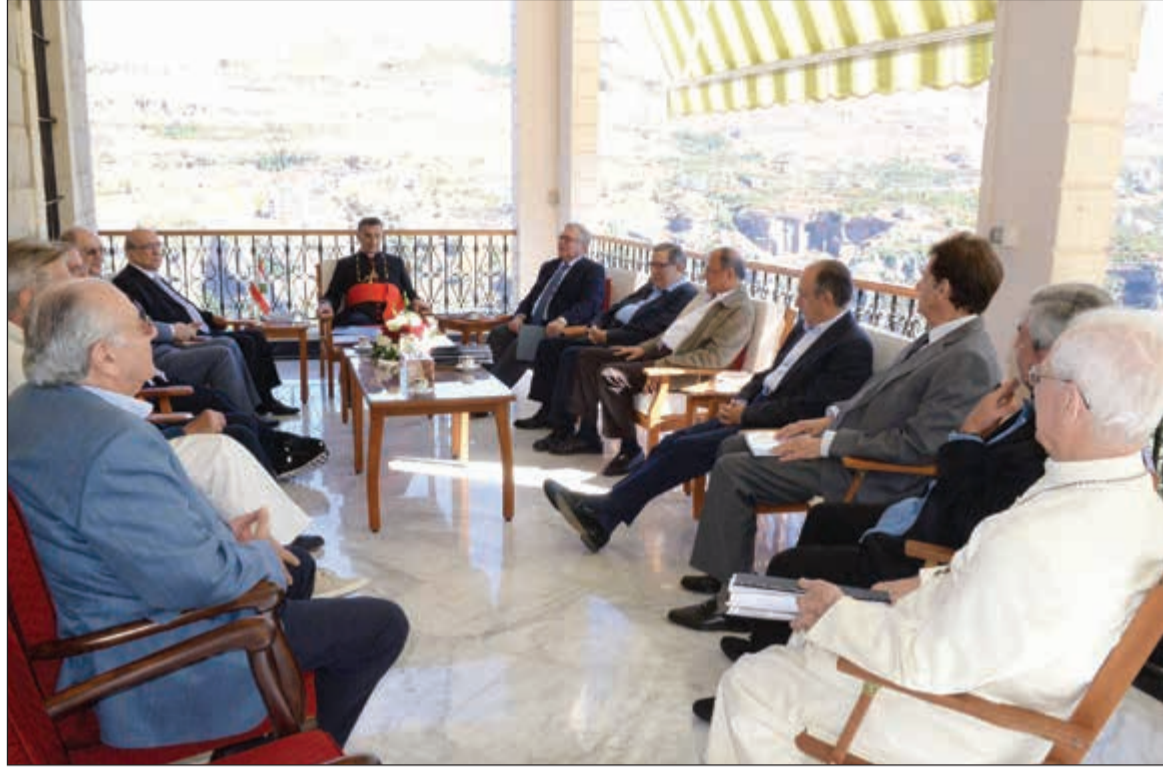
البطريرك بشارة الراعي خلال اجتماع موسع للمجلس الاقتصادي في مقره بالديمان

وقال: يتكلمون عن سلة تفاهم، فهل هذه السلة تحل محل الدستور؟ ان التقيد بالديمقراطية يعني عن أي سلة، وقد اعتبر كلامه هذا بمنزلة «حرم كنسي» على السلة ومحتوياتها.