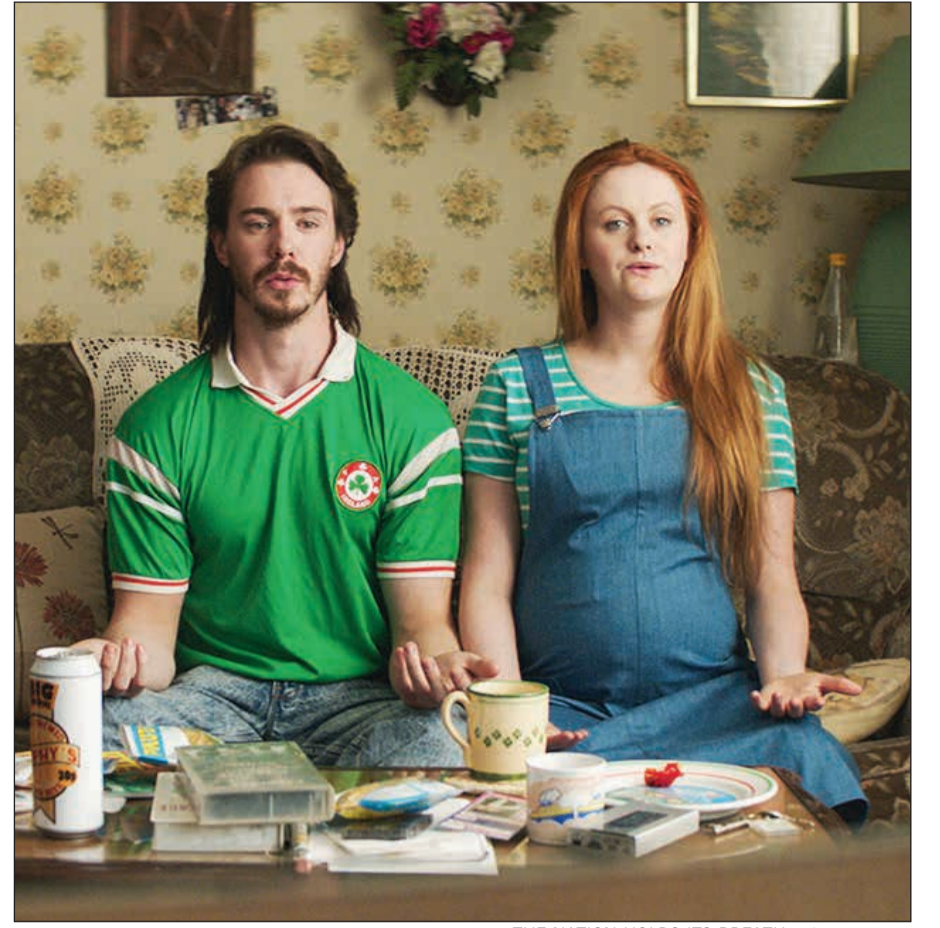
مشهد من فيلم «THE NATION HOLDS ITS BREATH»