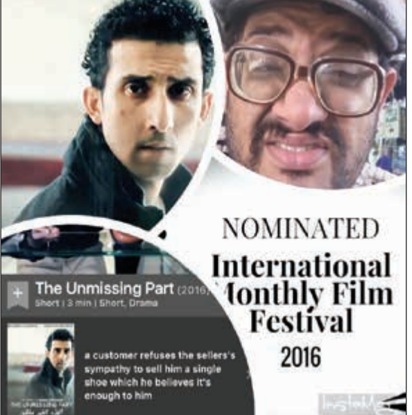
«The Unmissing Part» (2016) Short | 3 min | Short, Drama

عبد الحميد الخطيب حصده الفيلم الكويتي الصامت «الجزء غير المفقود» 3 جوائز في مهرجان «IMFF» الأميركي، قسم الأفلام القصيرة، باعتبار أصيبته تهم العالم أجمع، حيث يتناول قصة عن مبتوري الأقدام. على أخذ الفردة الأخرى، ومع مرور الأحداث يظهر الجانب الآخر في شخصية الرجل المبتور المليء بالأمل وحب الحياة، حيث يقوم باستغلال الفردة الأخرى من الحذاء في زراعة الورود. جدير بالذكر ان فيلم «الجزء غير المفقود» من إخراج أحمد الخصري،