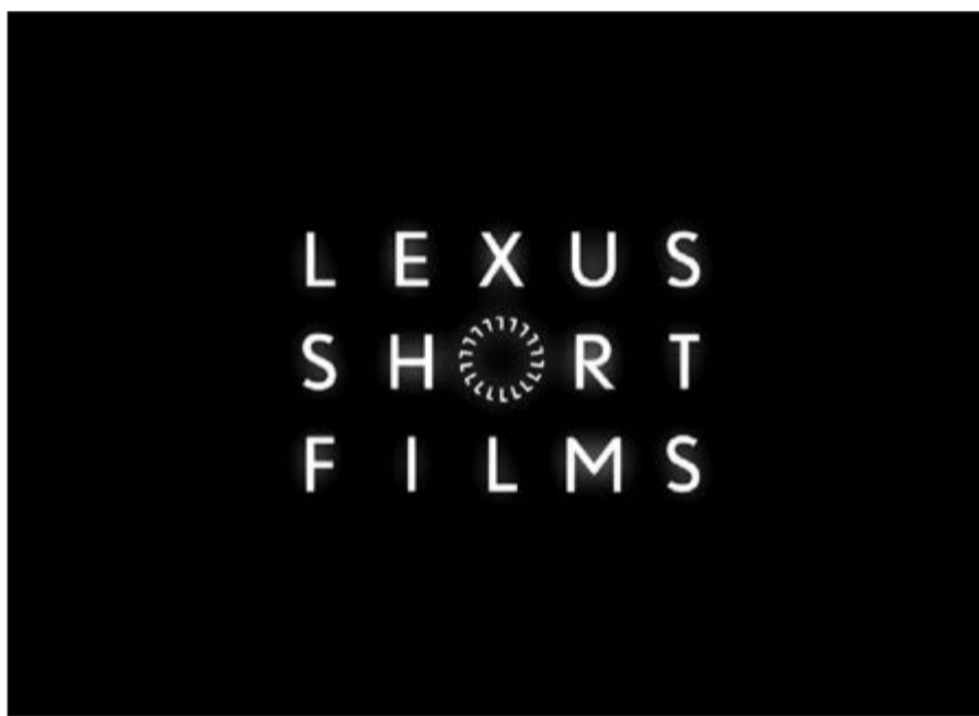
شعار جائزة لكزس للأفلام القصيرة