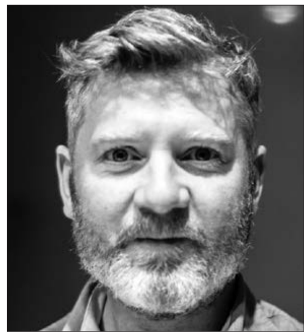
المخرج كيف كاهيل

«الأمم المتحدة» التي يتم إنتاجها من قبل جوي هورفيتز من شركة «وينشتاين» كجزء من الموسم الثالث من سلسلة أفلام لكزس القصيرة، والتي تعد تعاوناً بين شركتي «لكزس إنترناشيونال» و«وينشتاين» لدعم المواهب الناشئة في مجال صناعة السينما. وتدور أحداث فيلم «الأمة تحبس أنفاسها» الشيقة حول شباب في مقتبل العمر يوشك أن يصبح أباً، وهو متردد بين حضور معجزة ولادة طفله أو معجزة تأهل إيرلندا إلى الدور ربع النهائي من كأس العالم 1990، حيث كانت هذه المباراة أحد الأحداث الأكثر أهمية في تاريخ البلاد. ويستكشف الفيلم رحلة هذا الرجل والتحديات الصعبة التي يضعها القدر في طريقه. ويلعب دور البطولة في هذا الفيلم الممثل الإيرلندي الشهير سامم كيللي، والذي ظهر مؤخراً إلى جانب النجم برادلي كوبر في فيلمي «حرق» Burnt و«في عرض البحر» In the Heart of the Sea، بالإضافة إلى الممثلة الإيرلندية باربرا برينان، والتي اشتهرت بدورها في فيلمي «فيرونكا» Veronica Guerin و«مراقب لماري المجنونة» A Date For Mad Mary.