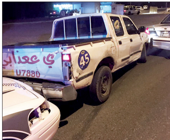
مركبة «رامبو» اصطدمت بعدة مركبات ودوريتين

وعدم حمل رخصة قيادة وخروج اصوات مزعجة من العادم وعدم الامتثال لرجال الامن والصعود على الرصيف المبلط ومخالفة شروط الامن والمتانة (تنزيل المركبة من الاسام) ووضع ملصقات (كتابة). واوضح المصدر انه اثناء تجول دورية تابعة لمخفر علي صباح السالم تمت مشاهدة مركبة وانيت بيضاء اللون تقوم بالاستهتار من دون لوحات وتصدر منها اصوات مزعجة، وعليه تم تشغيل الفلشر لملاحقة المركبة وتم الاتصال على ضابط المخفر