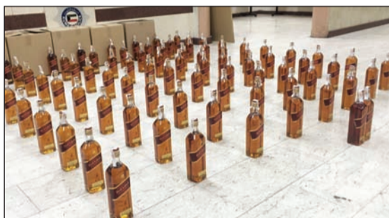
الخمر المستوردة التي ضبطت بحوزة مواطن

مخالفة مرورية مع تحويله إلى جهات الاختصاص. كما لقيت الدوريات الأمنية أثناء تجوالها في منطقة خيطان القبض على 3 وافدين من الجنسية المصرية بعد الإشتباه بهم حيث كانوا بحالة تعاط للمخدرات وعثر بحوزتهم على سيجارة خشيش غير مستعملة وورق لف ومبلغ 3610 دنانير وعليه تمت إحالة المذبوظين إلى جهات الاختصاص.