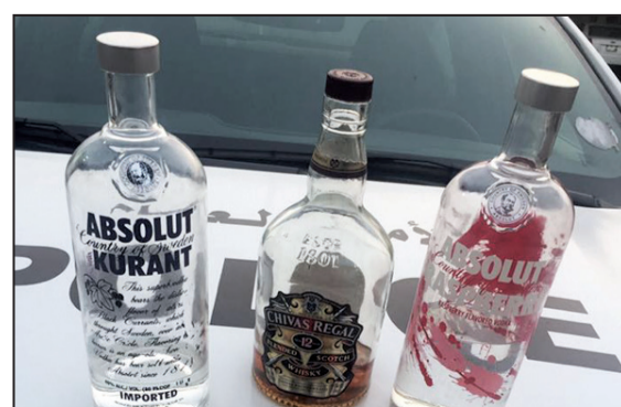
الخمر المستوردة المضبوطة

تمكن رجال الإدارة العامة لشؤون الإقامة من إلقاء القبض على وافد مصري يقوم باستخراج تصاريح مزورة عن طريق مندوب إحدى المزارع مقابل مبالغ مالية، وكانت معلومات قد وردت إلى الإدارة العامة لشؤون الإقامة من مصدرها السري تفيد بأن هناك مزرعة مسجلة عليها 145 عاملاً ولا يعملون داخل المزرعة، فتم استدعاء صاحبها ويسؤاله عن عمالة المزرعة أفاد بأن عددها 14 عاملاً أما البقية فلا يعلم عنهم شيئاً حيث تم مخاطبة هيئة القوى العاملة بطلب تقدير احتياج المزرعة ومن ثم تمت مخاطبة الهيئة العامة لشؤون الزراعة