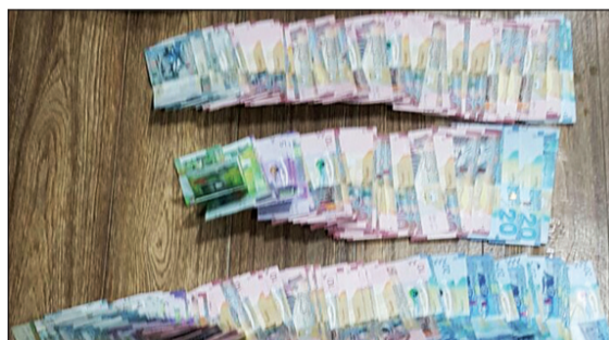
الدنانير المضبوطة بحوزة المصريين

الشيوخ شوهدت إحدى المركبات تسير بطريفة متعرجة بالشارع وعند إيقافها من قبل رجال الأمن لتحرير مخالفة مرورية بعد التأكد من قائدها رصد رجال الأمن كراتين بالمقعد الخلفي للسيارة وتتصاعد منها رائحة كريهة وتبين أن قائد المركبة بحالة غير طبيعية وعند تفتيش الكراتين تبين أنها تحمل قناني تحتوي على مادة مسكرة وعددها 120 زجاجة وتم تحرير