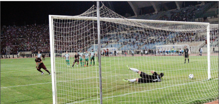
النجمة أهدر ضربة جزاء في المباراة

طفيفة، كما اعتدى بعض من الجمهور على لاعبي الأناضول وامتدت الإشكالات إلى المناطق المحيطة للملعب مع ملاحظات من الجيش الذي اضطر لإطلاق النار في الهواء. وعمق الغضب شيت جراح ضيفه طرابلس والديني فرس عدة أبرزها عبر أبو بكر التوالي 0-1 على ملعب أمين عبد النور البلدي ببحمدون. ولم ترق المباراة التي سيطر عليها الفريق الضيف إلى المستوى المطلوب، وسنحت أمام طرابلس فرص عدة أبرزها عبر أبو بكر التوالي 0-1 على ملعب أمين عبد النور البلدي ببحمدون. ووقعت المباراة التي سيطر عليها الفريق الضيف إلى المستوى المطلوب، وسنحت أمام طرابلس فرص عدة أبرزها عبر أبو بكر التوالي 0-1 على ملعب أمين عبد النور البلدي ببحمدون. ووقعت المباراة التي سيطر عليها الفريق الضيف إلى المستوى المطلوب، وسنحت أمام طرابلس فرص عدة أبرزها عبر أبو بكر التوالي 0-1 على ملعب أمين عبد النور البلدي ببحمدون.