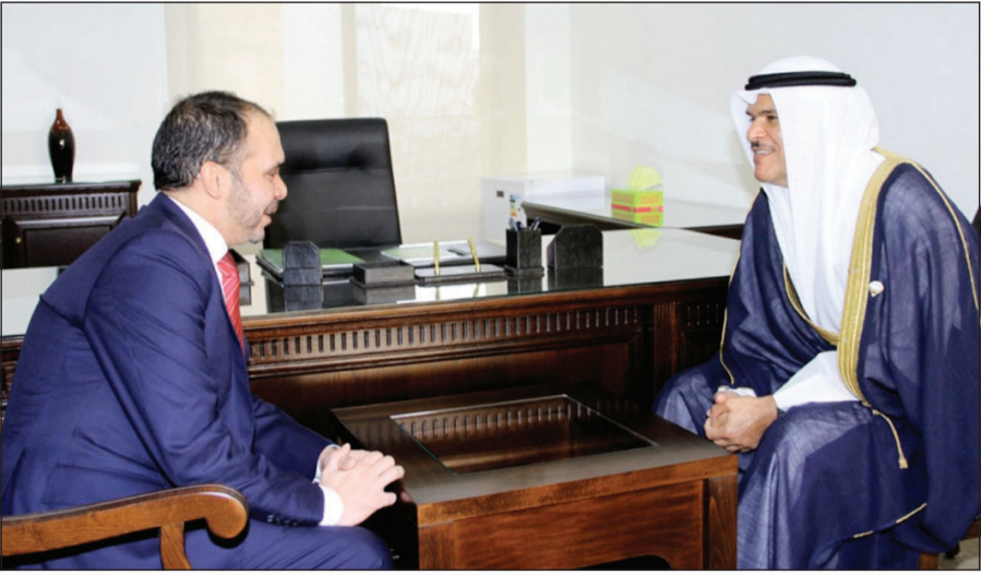
وزير التعليم الدكتور أحمد الحمود في حديث مع السفير علي بن الحسين