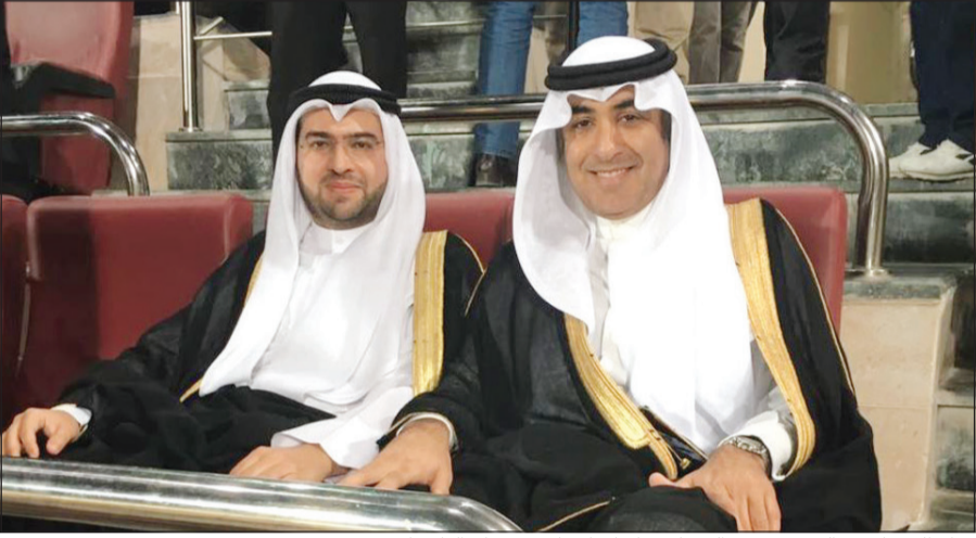
فواز الحساوي والشيخ حمود الصباح يتابعان افتتاح مونديال الناشئات

من جهته، أعرب نائب المدير العام للإنشاءات والصيانة في الهيئة العامة للشباب والرياضة الشيخ حمود المبارك الصباح عن الاعتزاز والشعور بالفخر للإنجاز الأردني العربي المتمثل باستضافة البطولة العالمية لكرة القدم، مؤكدا أهمية الإطلاع على التجربة الأردنية عن قرب للاستفادة منها والتعرف على إيجابياتها. وأثنى الشيخ حمود على جهود الشباب الأردني وقدرته على عكس صورة مشرفة عن بلدهم الأردن من خلال التنظيم اللافت والاستعدادات المناسبة، ما يؤكد على أن الشباب العربي قادر على الإبداع والتميز والتنافس متى ما أتاحت الفرصة له.