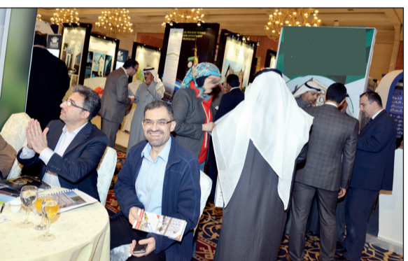
جانب من معارض سابقة

مركز البيت العالمي العقارية على أبو الخير مشاركة الشركة في معرض المال والعقار والاستثمار الدولي، وأفاد بان الشركة عقارية كويتية متخصصة داخل جمهورية البوسنة والهرسك، كما تقوم ببناء وحدات سكنية وتقوم أيضا بتخليص جميع أنواع المعاملات داخل جمهورية البوسنة من بيع وشراء واستثمار وإعادة بيع وحجوزات فنادق وتأجير سيارات وفيلات وتأسيس الشركات والتسويق العقاري. وأشار أبو الخير إلى ان الشركة تمتاز بأنها تعمل وتسوق لمشاريع هي ملك بالكامل للشركة حيث ان معظم الأراضي والمشاريع تم اختيارها بعناية فائقة، كما تقوم الشركة بالتسويق في بعض الدول مثل اسبانيا وتركيا ومصر. وقال: نسعى دائماً في مركز البيت العالمي العقاري لتقديم ما هو أفضل لخلق فرص حقيقية للمتلحم والاستثمار العقاري المتميز في بعض المدن العالمية حيث يرغب المستثمر الكويتي في التملك في سوق العقار العالمي، حيث نواجه تحديات كبيرة في اختيارنا لتقديم ما هو أفضل، كما أننا نوفر فرص جيدة للاستثمار، وذلك من خلال اختيار العقار المناسب، كما أننا نختار العقار المناسب من عدة محاور أساسية ونذكر منها الموقع وبعده عن سندر المدينة والمساحات المتعددة والخدمات المتوفرة بمشاريعنا بما يفيد رغبى التملك بالراحة والرفاهية والأمان بالإضافة إلى اهم عنصر، أننا راغبنا السعر المناسب لجميع فئات المستثمرين.