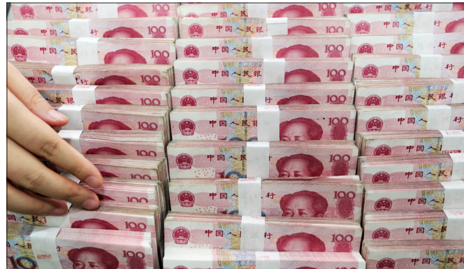
اليوان ينضم إلى الدولار واليورو والين والإسترليني في سلة عملات حقوق السحب الخاصة

وكالات: دخلت العملة الصينية أمس إلى النادي المغلق للعملات المرجعية المعتمدة لدى صندوق النقد الدولي إلى جانب الدولار واليورو، في تطور اعتبره بكن «منعطفًا تاريخيًا» في طريق تحول اليوان إلى عملة دولية، وإعادة ب «تعميق» الإصلاحات المالية. ويندمج اليوان رسمياً اعتباراً من أمس في سلة حقوق السحب الخاصة، الوحدة الحسابية المعتمدة من صندوق النقد الدولي، حيث ينضم إلى العملتين الأمريكيتين والأوروبية، إضافة إلى الجنيه البريطاني والين الياباني.