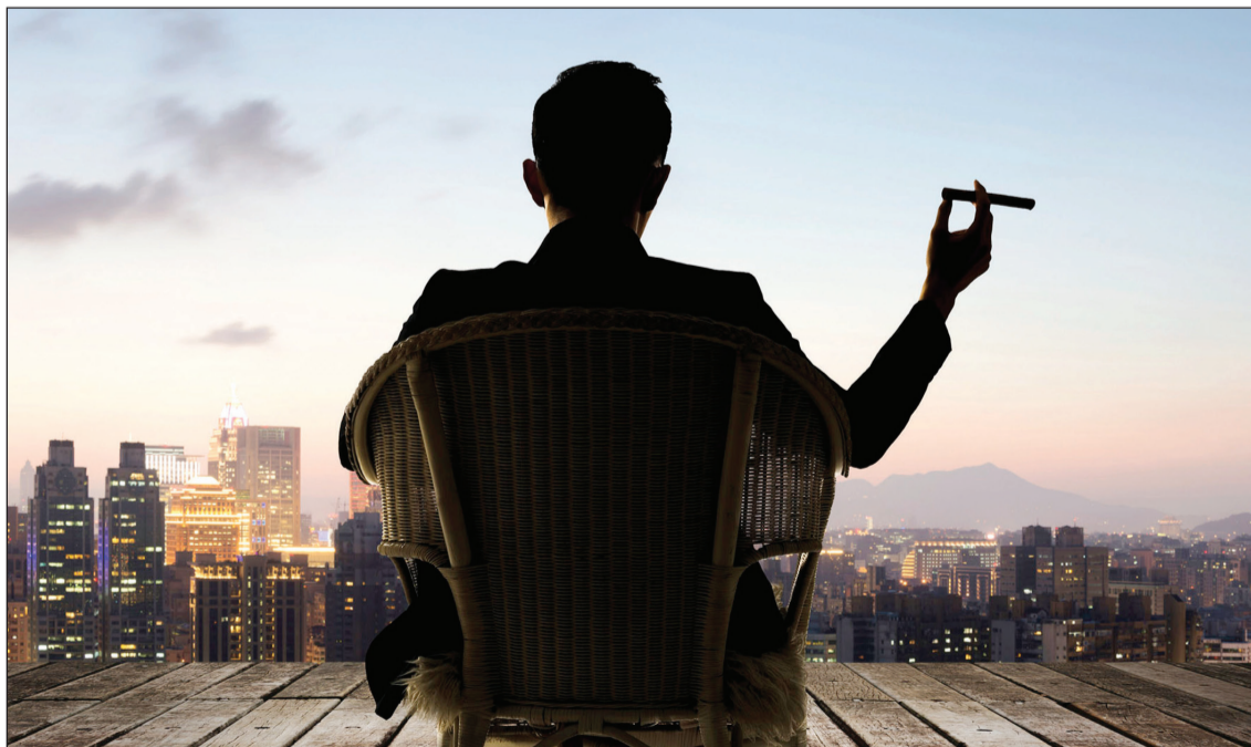
الأثرياء يزدون رغم أزمة النفط