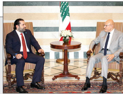
سعد الحريري خلال لقائه رئيس الحكومة تمام سلام

لبنان: الحريري ينهي مشاوراته الرئاسية المحلية بلقاء سلام ويبدأ الخارجية من موسكو 18