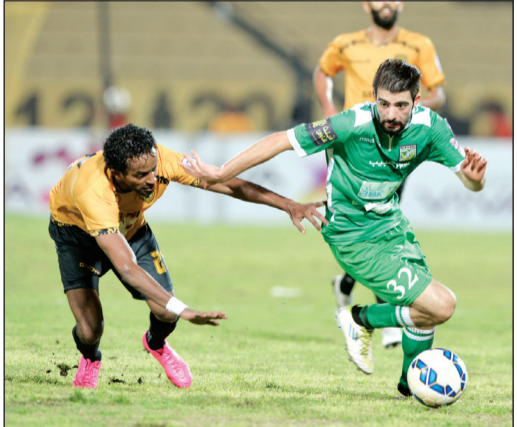
«دريبي»، تاري بين العربي والقادسية (الأزرق، كوم)

هيلاري تتقدم.. ومناعب ترامب مع المحافظين تتفاقم