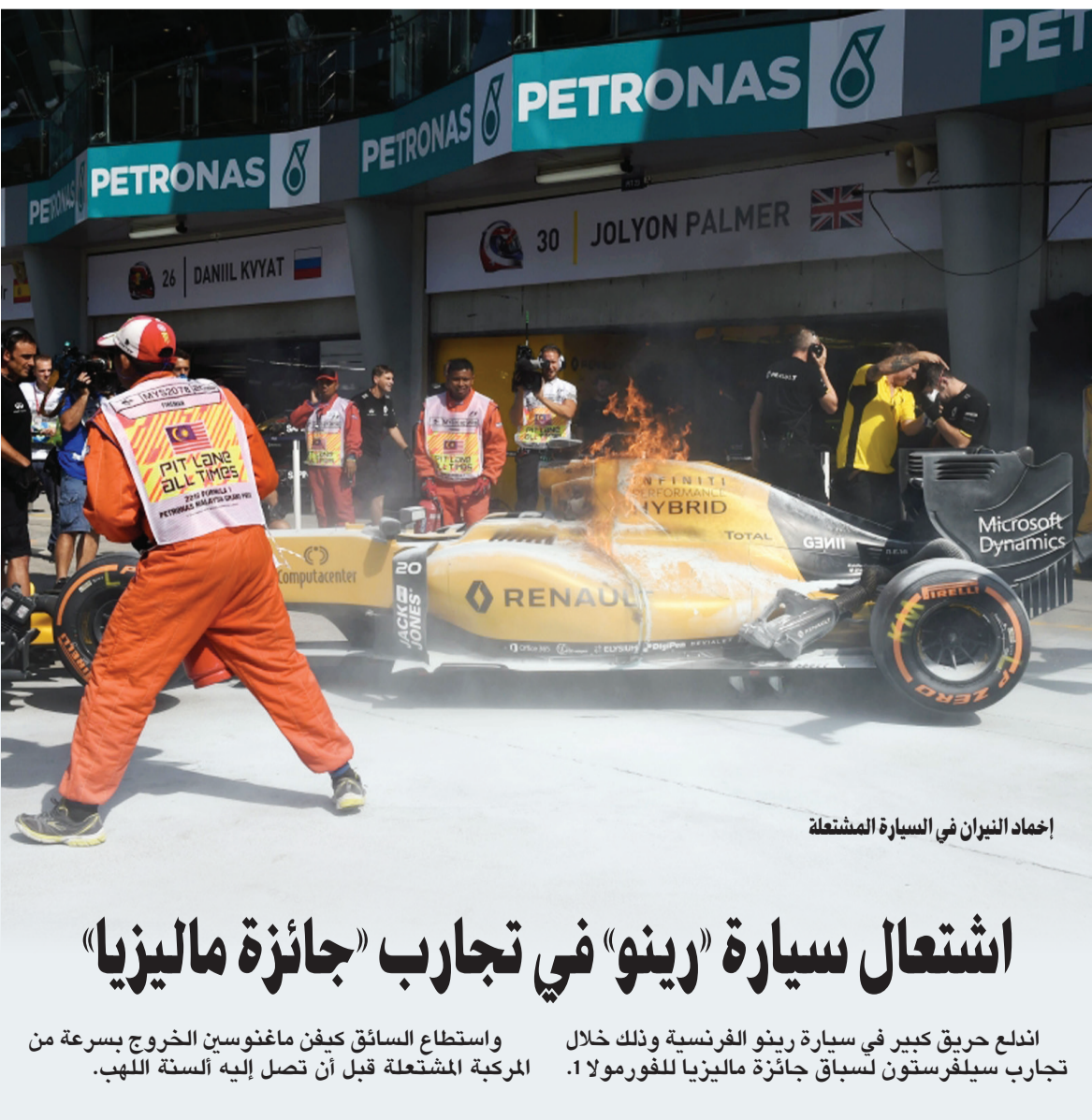
إخماد النيران في السيارة المشتعلة

ورفع الطلائع والإسماعيلي رصيدهما إلى 4 نقاط في المركزين السادس والسابع على الترتيب في جدول