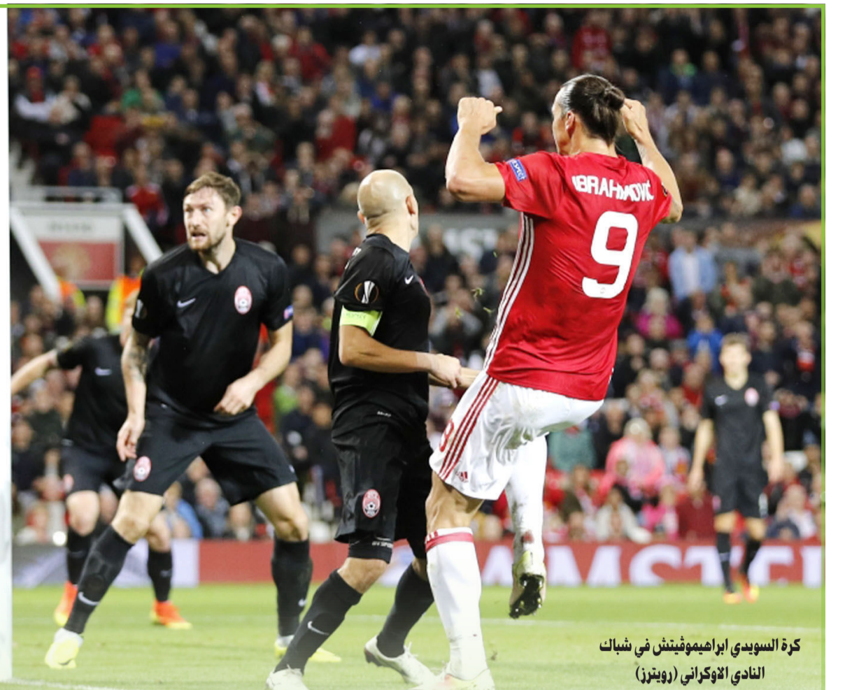
كرة السويدي ابراهيموفيتش في شباك النادي الأوكراني