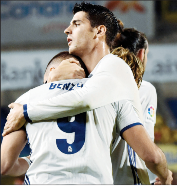
موراتا يعاني لحجز مكانه في ظل تواجد بنزيما

أكدت تقارير صحافية أن نادي أرسنال وتشلسي دخلا في صراع قوي للتعاقد مع الفارو موراتا مهاجم نادي ريال مدريد الإسباني، خلال الانتقالات الصيفية القادمة.