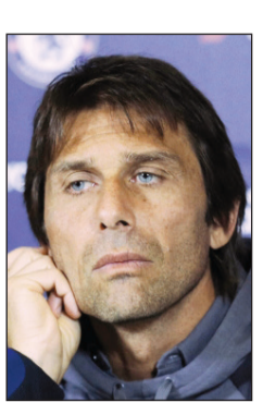
كونتي محبط من لاعبيه

أكد مدرب تشلسي أنطونيو كونتي لرجل الأعمال الروسي رومان أبراموفيتش حاجة لاعبي فريقه لإعادة بناء شاملة، حيث عانوا من عدة مشاكل فنية ونفسية على مدار الموسم الماضي، ظهرت بعض بوادرها خلال المباريات الثلاث الماضية.