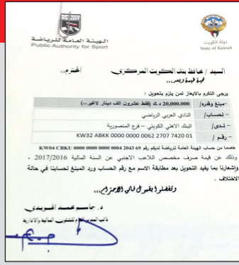
صورة كتاب تحويل المبلغ

قامت الهيئة العامة للرياضة بتحويل مخصصات المحترفين الأجانب إلى حساب النادي العربي والبالغ 20 ألف دينار، وهي قيمة الدعم السنوي الخاص بالمحترف حسب اللوائح المعمول بها. وتم تحويل صرف المبلغ المخصص من قبل البنك المركزي إلى بعد غد الاثنين، بسبب الإجراءات الروتينية التي تعطلت لعدم وجود تاريخ على كتاب التحويل، إضافة إلى أن غدا الأحد إجازة رسمية. وسيتم تحويل المبلغ المخصص إلى حساب العربي، والذي ستؤول الإدارة مهمة صرفه في حسابات المحترفين الأجانب حسب اللائحة الخاصة في هذا الشأن. أحمد السلامي