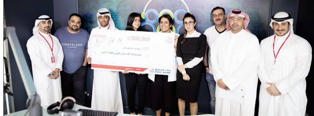
موظفو بنك الخليج يحتفلون مع الفائزين عقب إجراء السحب

أعلن بنك الخليج عن أسماء الفائزين في سحبه ربع السنوي «3 في 1» الذي أقيم أول من أمس خلال برنامج «الديوانية» عبر محطة مارينا أف أم الإذاعية، وتم إجراء 3 سحبيات في نفس الوقت والمكان. فقد اجري سحب الدائنة على جائزة نقدية بقيمة 500 ألف دينار، بينما تضمن سحب حسابي الراتب وred جائزة عبارة عن سيارة كاديلاك CTS 2016 جديدة، بالإضافة إلى جوائز نقدية تصل قيمتها إلى 1000 دينار، وقد اجري السحب تحت إشراف وحضور ممثل عن وزارة التجارة والصناعة. ويتقدم «الخليج» بخالص التهاني إلى الفائز في سحب