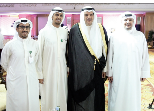
فريق العلاقات العامة في «بيتك» مع الشيخ سلمان الحمد على هامش المؤتمر

العديد منها والتي تم إطلاقها في سبيل تمكين الشباب، وعلى سبيل المثال لا الحصر مؤتمر تمكين الشباب الذي يستقطب شخصيات ذات خبرات وتجارب عملية ناجحة يستفيد منها شريحة كبيرة من الشباب. ودعا المؤتمر الشباب الى التركيز على ترسيخ ثقافة جديدة للطوع في البلاد تقوم على تعزيز القيم الإسلامية والمجتمعية الأصيلة مدعومة بمنهج علمي وعملي متقدم في العمل التطوعي، كما يتيح الفرصة للشباب للالتقاء مع أبرز الشخصيات العالمية من أكاديميين إلى صانعي ابرز العلامات التجارية فضلاً عن الشخصيات المحلية البارزة في مجال الاقتصاد والتنمية والصناعة.