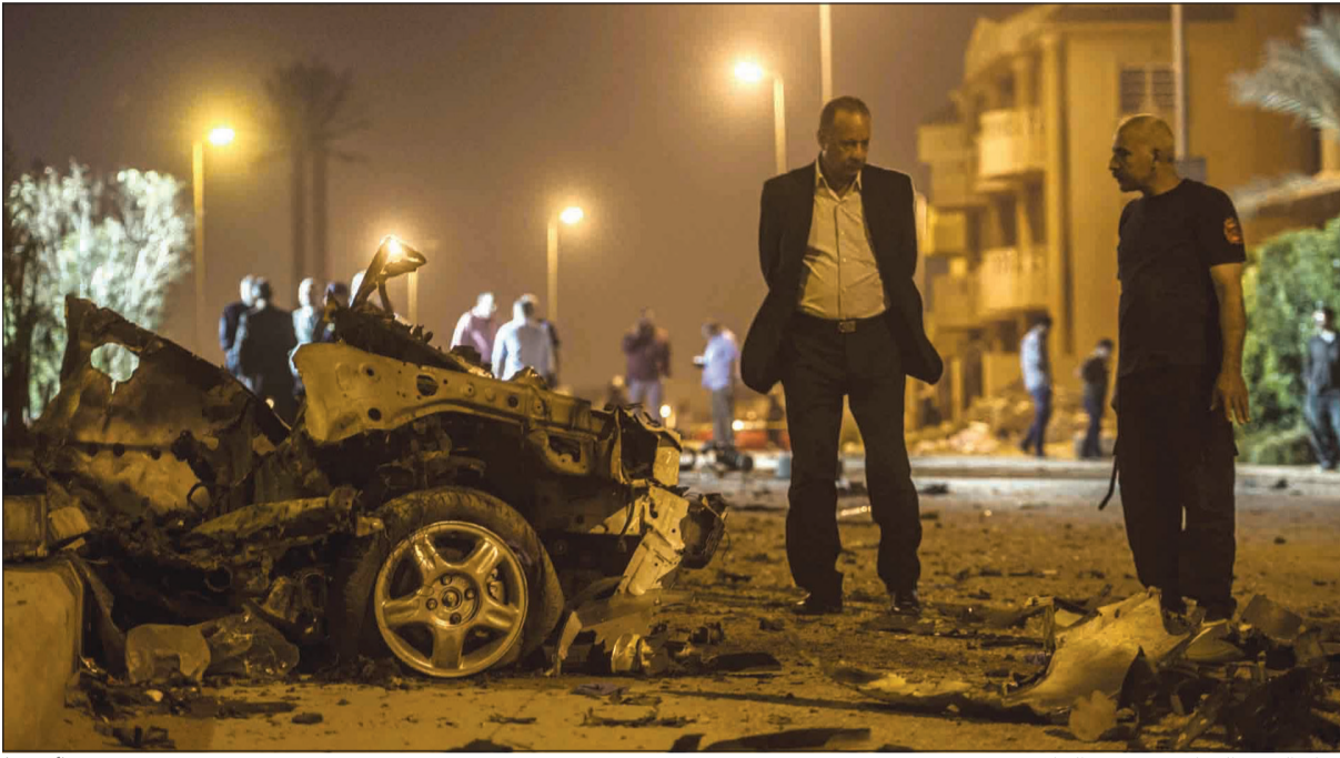
رجال البحث الجنائي في موقع الحادث

● وجهت الأجهزة الأمنية نداء عاجلاً إلى المواطنين بسرعة تقديم أي صور أو فيديوهات التقطوها للحادث.