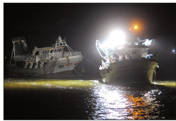
لجنة انتشال قارب رشيد الذي عجل بمناقشة قانون الهجرة غير الشرعية

مشروع القانون بحضور ممثلي الحكومة. ومشروع قانون مكافحة الهجرة غير الشرعية وتهريب المهاجرين يتكون من 34 مادة، ومن المقرر أن تتم مناقشة التقرير النهائي بعد أن تسلمه امس د.علي عبد العال في الجلسة الافتتاحية لدور الانعقاد الثاني والمقرر لها الثلاثاء المقبل 4 الجاري. وأكد المستشار بهاء أبو شقة رئيس لجنة الشؤون الدستورية والتشريعية