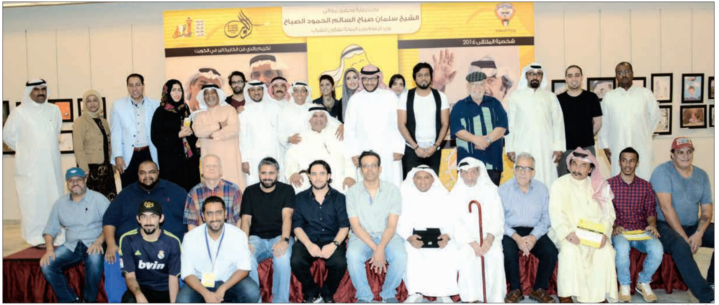
لجنة جماعية للمشاركين في ملتقى الكويت الدولي للكاركاتير الأول