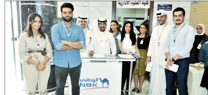
البنك الوطني يدعم مسابقة «جامعتنا»

جامعة الكويت وعمادة شؤون الطلبة في البوتوب وجميع قنوات التواصل الاجتماعي لحساب العمادة، وأوضح الكندري أن آلية عمل المسابقة عن طريق تجول فريق اللجنة الإعلامية في كليات الجامعة وطرح أسئلة عامة على الطلبة، مبيحة أن اللجنة خصصت جوائز مالية للفائزين في