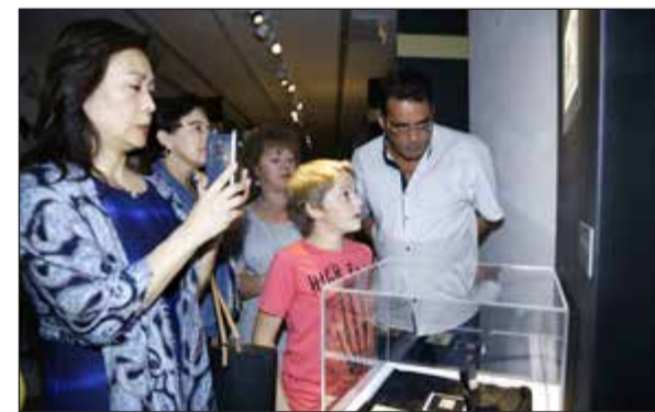
جانب من زوار معرض مكة من فضة

هي: أفغانستان، والجزائر، وبنغلاديش، والكاميرون، وجزر القمر، وإيران، والعراق، والأردن، والكويت، وليبيا، وماليزيا، ومالي، وموريتانيا، والمغرب، والنيجر، وعمان، وقطر، والمملكة العربية السعودية، والصومال، وسورية، وتونس، ودولة الإمارات العربية المتحدة، واليمن. وهذه الطابعات الفضية نسخة طبق الأصل من الطابع البريدية الأصلية، وأصبحت تحفاً تاريخية ذات أهمية كبيرة، ولصنع هذه المجموعة التذكارية، أعدت في دار المسكوكات في موسكو نماذج يدوية بالحجم الطبيعي للطابع، نفذت بالخط النافر لتكتسب شكلاً ثلاثي الأبعاد.