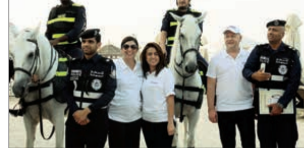
جانب من زوار معرض مكة من فضة

● بشكل فندق ومنتججميرا شاطئ المسيلة وجهة متكاملة