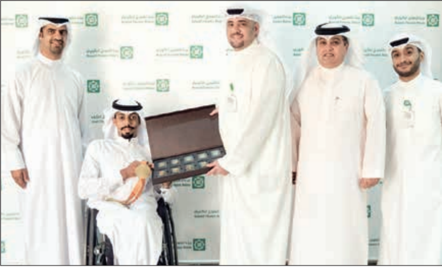
المطيري يتسلم الجائزة

البطولات العالمية وتحطم الأرقام القياسية في مختلف الرياضات. وكان البطل أحمد المطيري قد رفع علم الكويت في دورة الألعاب البارالمبية وحقق رقماً قياسياً أو بلداً جديداً في سباق 100 متر جري على الكراسي المتحركة بزمن قدره 16 ثانية و16 جزءاً من المئة من الثانية، وجاء هذا الفوز بعد نيله بطولة العالم الأخيرة في قطر.