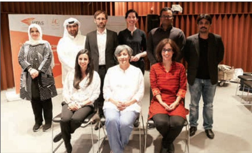
لقطة تذكارية للمشاركين

ورشة العمل ربط المشاركين من المهندسين والمعماريين والأدبيين وصناع القرار والمعنيين بقطاع الإنشاءات والبناء ببعضهم البعض وبحثوا في أهمية الإسكان للاقتصاد، وذلك مناقشة النتائج الأولية للمشروع الذي تجريه الجامعة عبر اتفاقية مع المؤسسة، وإتاحة الفرصة لتوظيف مخرجات هذا المشروع في خدمة القطاعين المحليين في الكويت. وأوضح الكندري أن بناء الكفاءات المحلية في المجالات ذات الأولوية الوطنية هو أحد أهم أهداف المؤسسة، لذلك يتم التعاون مع الجامعات التي تتكيف مع احتياجات المؤسسة لبناء الكفاءات وللمساعدة في القرارات المبنيّة على أسس علمية في المجالات ذات الأولوية الوطنية كالصحة والطاقة والإسكان. وقال بأنه ضمن هذه الاتفاقيات كانت أهداف