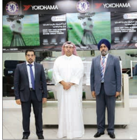
مسؤولو الساير مع مسؤول وزارة التجارة خلال السحب