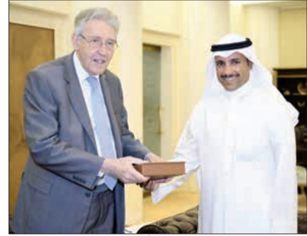
رئيس مجلس الأمة مرزوق الغانم يستقبل عضو مجلس اللوردات البريطاني

هذا الموضوع، وفي انتظار موقف الحكومة من هذه الدعوة للاجتماع المقبل المتوقع الأسبوع المقبل، أشار إلى أن التاريخ المحدد للدورة الطارئة كان 22 الجاري وهو نفس اليوم الذي تقدم به الطلب، إذ لا يعقل أن تتم كل هذه الإجراءات في يوم واحد، كما احتوى الطلب عبارة تتيح التوافق مع الحكومة على الموعد الجديد في أقرب وقت ممكن وهو ما نقوم به حالياً. ورداً على تصريحات سابقة تتحدث عن تناقض بين تصريحاتي وتصريحات رئيس وأعضاء اللجنة المالية، قال الرئيس الغانم «إن الموضوع واضح ولا يجعل أحداً يشك بوجود التناقض، فموضوع البنزين لا