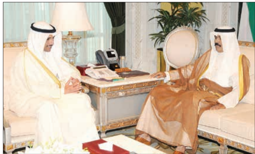
سمو نائب الأمير وولي العهد الشيخ نواف الأحمد مستقبلاً رئيس مجلس الأمة مرزوق الغانم