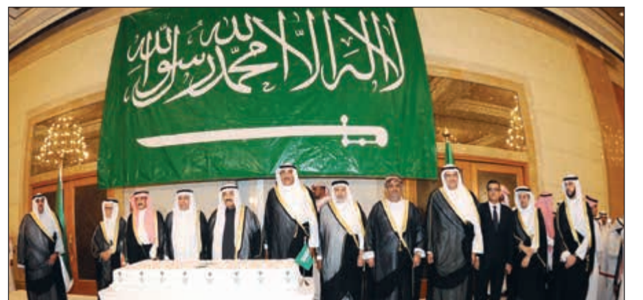
سمو الشيخ ناصر المحمد والشيخ صباح الخالد والشيخ د. ابراهيم الدعيج والشيخ سلمان الحمود مع السفير السعودي د. عبدالعزيز الفايز وعدد من الحضور خلال الاحتفال باليوم الوطني للمملكة (هاني الشمري)

للفوز بمقعد غير دائم في مجلس الأمن، قال الجارالله إن الحملة متواصلة ومستمرة، والكويت تحركت على جميع المستويات الدولية والإقليمية والعربية، لافتاً إلى أن النائب الأول لرئيس مجلس الوزراء وزير الخارجية الشيخ صباح الخالد أجرى خلال وجوده في جنيف أكثر من 30 لقاء مع وزراء خارجية كانت تهدف إلى حشد الدعم للكويت للحصول على مقعد غير دائم في الأمم المتحدة بالإضافة إلى تعزيز التعاون المشترك مع تلك الدول.