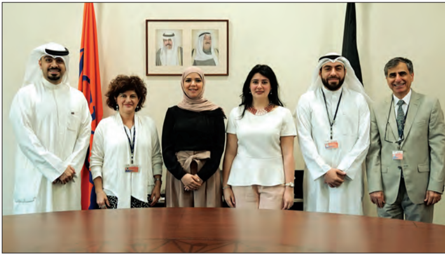
فريق العلاقات العامة في «الوطني» في صورة جماعية مع الإدارة التنفيذية في الكلية الأسترالية

وتطوير إمكاناتهم لتمكينهم من الانخراط في سوق العمل ومواجهة متغيراته. وأكدت أن بنك الكويت الوطني أخذ على عاتقه الرعاية ودعم كل النشاطات والفعاليات التي تنظمها الكلية الأسترالية خلال العام بما فيها المحاضرات، ورش العمل، المعارض، اللقاءات، الدورات التدريبية وغيرها. مضيفة أن البنك يقدم دعمه للكلية الأسترالية بهدف تشجيع الطلبة على المشاركة في البرامج والأنشطة التي تعزز خبراتهم ومعرفتهم لضمان تطورهم المستمر.