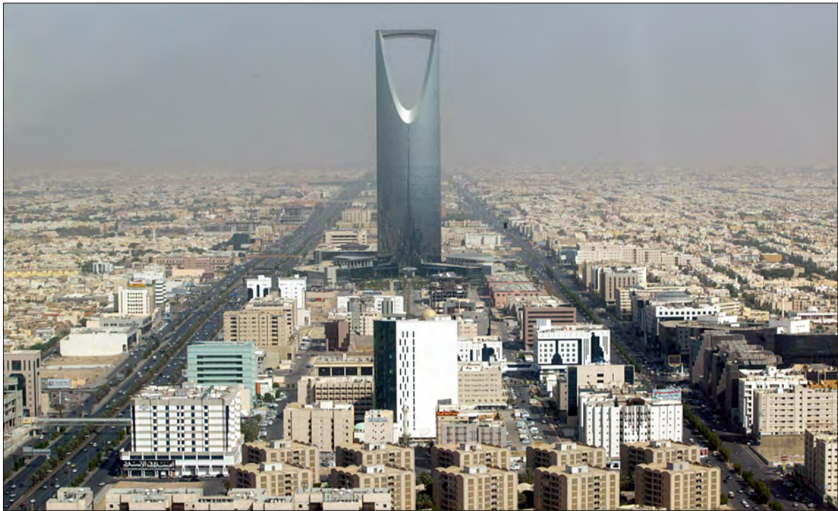
مؤسسة النقد العربي السعودي تتخذ مزيداً من الإجراءات لدعم الاستقرار المالي في المملكة وفترة في أسعار الاسهم المصرفية

العربية: على الرغم من قوة الموقف المالي للبنوك والاقتصاد السعودي إلا أن مؤسسة النقد العربي السعودي «ساما» أعلنت أمس الأول عدداً من الإجراءات التي تستهدف دعم الاستقرار المالي ويرى متخصصون أن مؤسسة النقد العربي السعودي تستبق أي أمور قد تنتج عن نقص السيولة، عبر قرارات رامية إلى دعم الاستقرار المالي المحلي. وكانت «ساما» قد وضحت أمس أكثر من 20 مليار ريال سعودي كودائع زمنية لدى القطاع المصرفي نيابة عن جهات حكومية، إضافة إلى توفير فترة آجال استحقاق لاتفاقيات إعادة الشراء تتمثل في مدتي 7 أيام و28 يوماً، مقارنة باقتصار هذه الاتفاقيات على أجل ليلة واحدة.