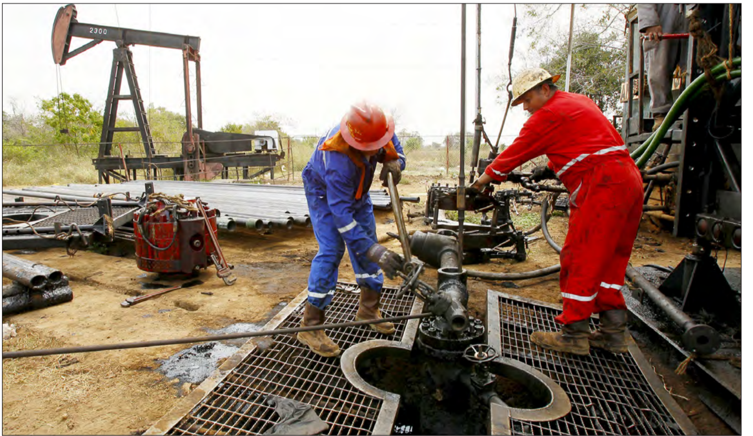
معرفة في «أوبك» لتثبيت الإنتاج

العرض والطلب وإزالة فائض العرض. وأكد المصدر أن إيران عطلت المساعي السعودية بطلبتها بحصة تبلغ 4,1 ملايين برميل يومياً، في حين ارتفع إنتاجها إلى 3,6 ملايين برميل يومياً بعد رفع عقوبات دولية عنها إثر تسوية ملفها النووي مع الغرب. وأشار المصدر إلى أن فريقاً تقنياً سعودياً قدم في اجتماع ضمه في فيينا الجمعة الماضية إلى مسؤول تقني إيراني، في حضور ممثلي الجزائر وقطر في أوبك والأمن العام للمنظمة جميع أعضاء أوبك على قرار، فأعتقد أن هناك احتمالاً كبيراً للحصول على دعم الآخرين